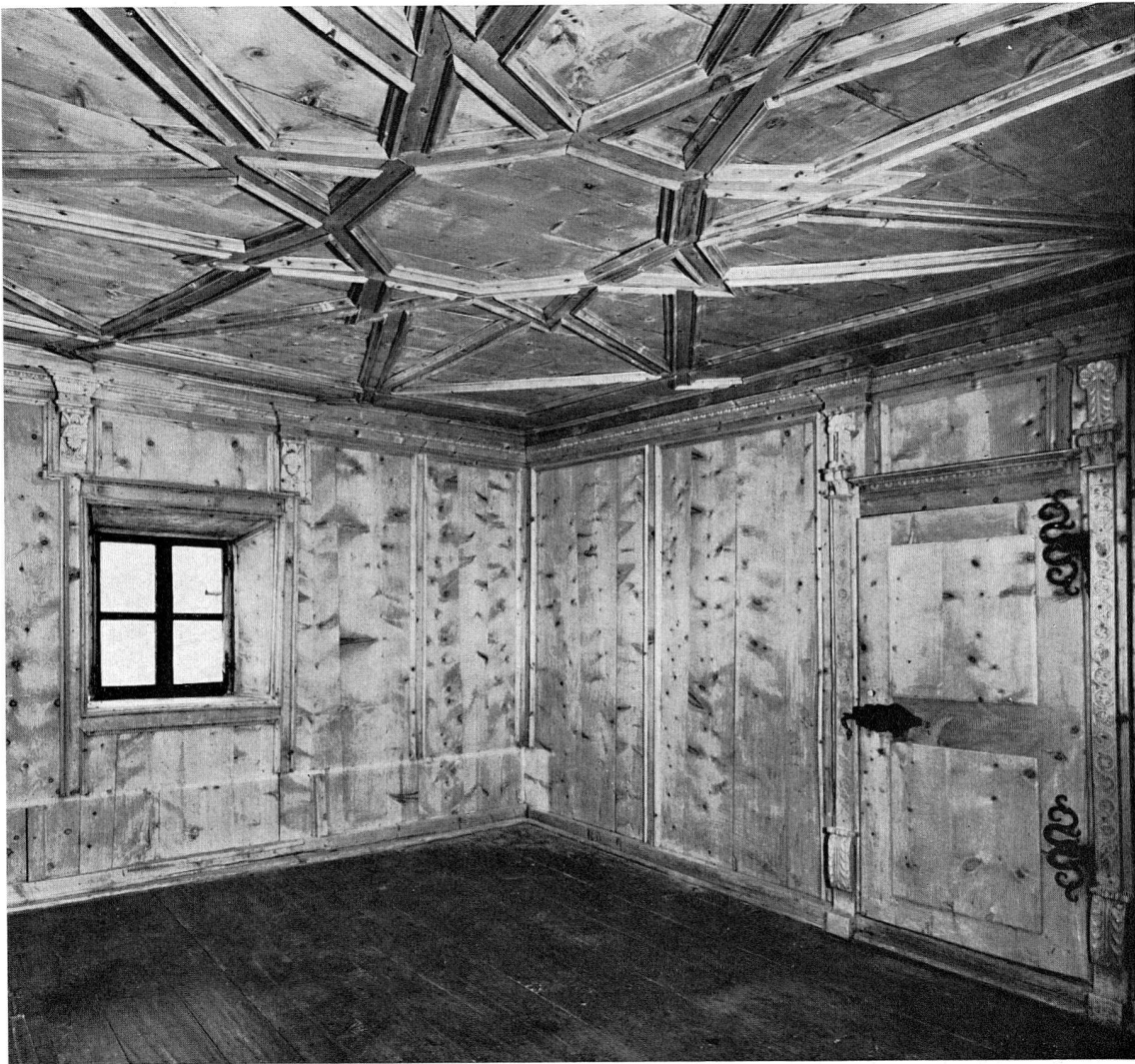
Abb. 35. Interieur in Arvenholz, aus Schuls, Kt. Graubünden. 17. Jh. 2. Hälfte (S. 45)

LM 29779 Messingstempel des Regiments Schwaller in königlich-spanischen Diensten. 1835 dem Bund abgeliefert. G: Bundesarchiv Bern