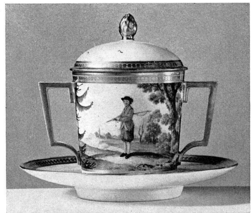
Abb. 33. Trembleuse aus Porzellan. Nyon. Um 1800 (S. 43)