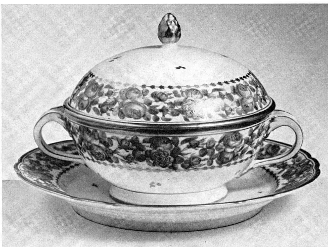
Abb. 34. Bouillontasse mit Präsentierteller aus Porzellan. Nyon. Um 1800 (S. 43)