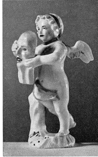
Abb. 32. Putto mit Maske, aus Porzellan. Berlin. Um 1755 (S. 43)