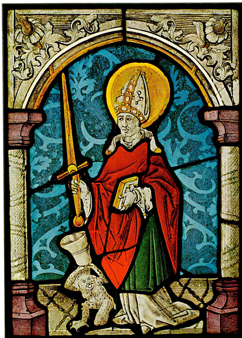
Hl. Theodul, Landespatron des Wallis. Glasgemälde um 1510 (S. 52)