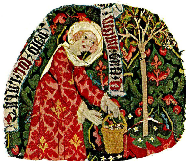
Abb. 1. Wildleutepaar im Gespräch. Frau, die Holunderblüten aufliest. Zwei Fragmente von verschiedenen Wollwirkereien. Basel (Oberrhein), um 1470. Oben: Vorderseiten. Unten: die farblich besser erhaltenen Rückseiten (S. 18)