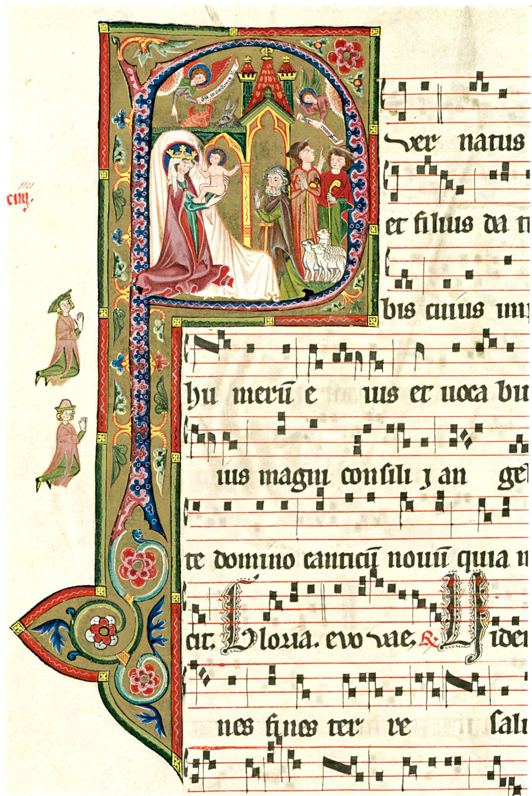
Abb. 1. Weihnachten, Miniatur aus dem Graduale von St. Katharinenthal, um 1312 (S. 10)