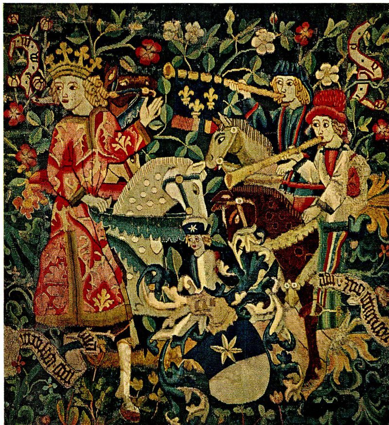
Abb. 1. Bildwirkerei mit Wappen Bubenbergh, um 1470 (S. 9)