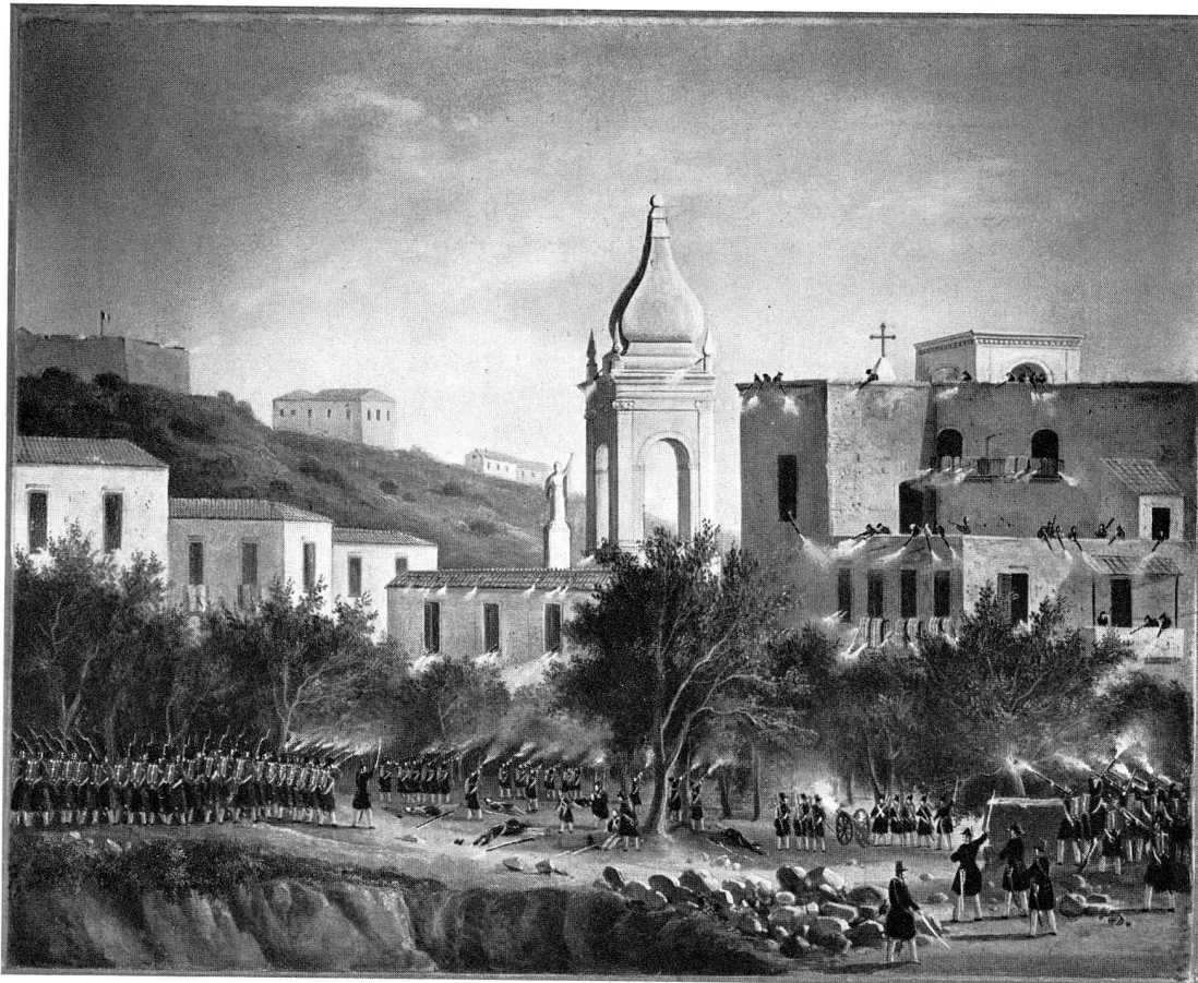
Abb. 45. Szene aus der Eroberung von Messina durch Schweizerregimenter, 1848, Öl auf Leinwand (S. 36)