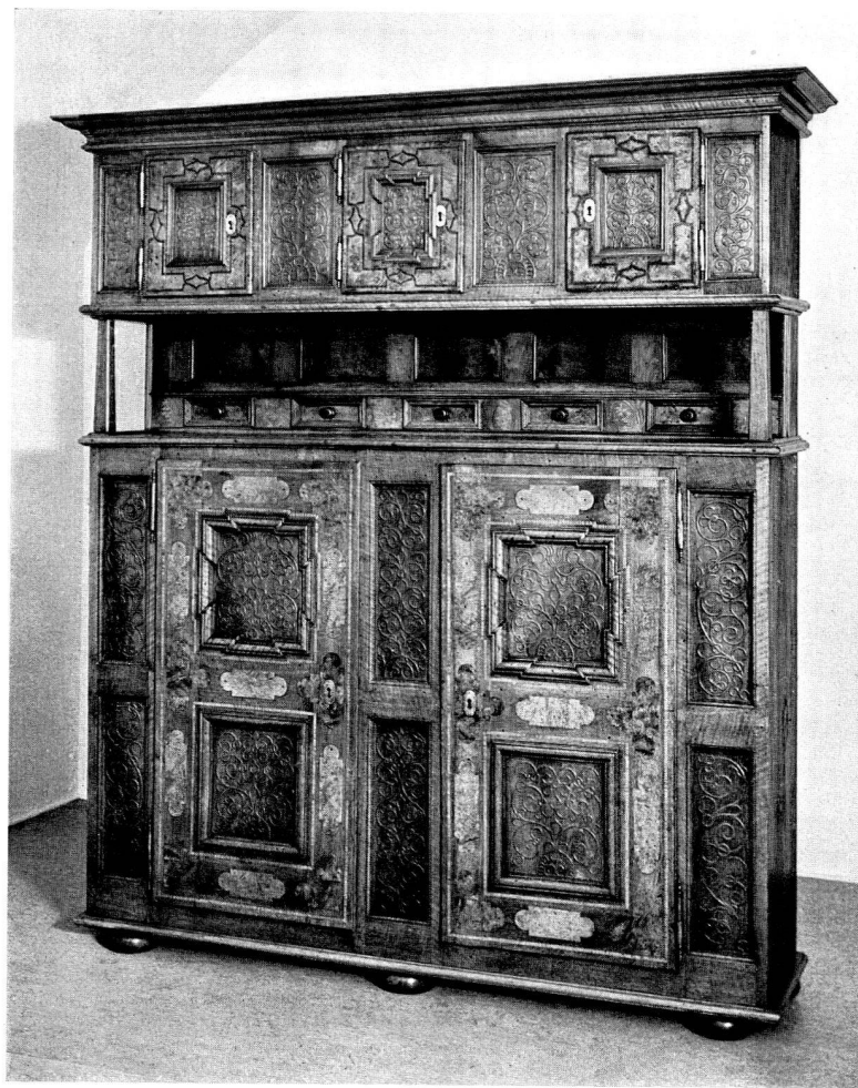
Abb. 22. Simmentaler Büfett, 1756 (S.11)