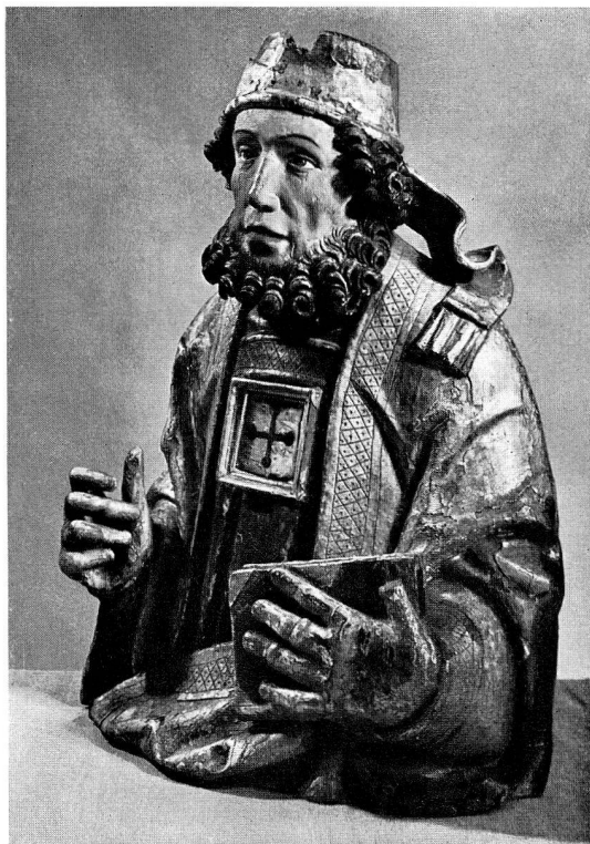
Abb. 24. Hl. Papst, Lindenholz, um 1680 (S.30)