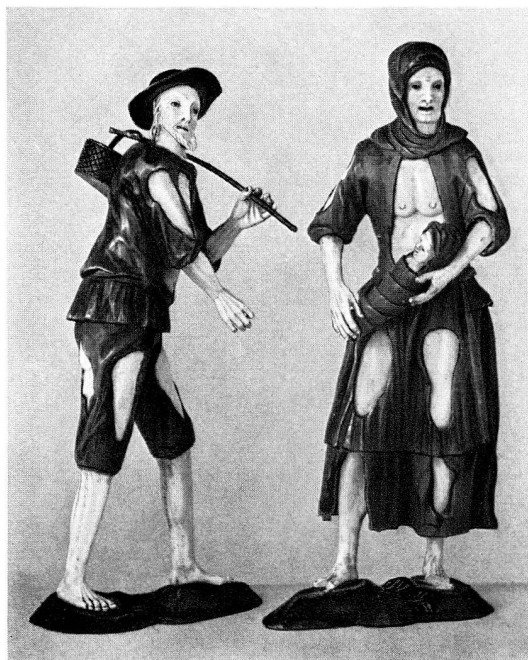
Abb. 21. Bettlerpaar, Holz und Elfenbein, um 1700 (S. 30)

Buchowiecki, Walther. — Die gotischen Kirchen Österreichs. Wien 1952