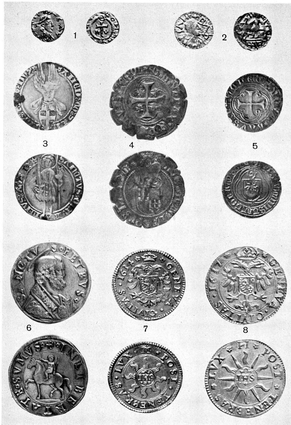
Abb. 22. 1. St-Maurice, Triens, Gold – 2. Basel, Triens, Gold – 3. Savoyen, Amadeus VIII., Münzstätte Nyon, Mezzo Grosso – 4. Bistum Lausanne, G. de Varax, Parpaillole – 5. Bistum Lausanne, B. Chuet, halbe Parpaillole – 6. Urkantone in Bellinzona, Testone – 7. Genf, Pistole 1634, Gold – 8. Genf, Quadruple 1637, Gold. (S. 32 u. 34)