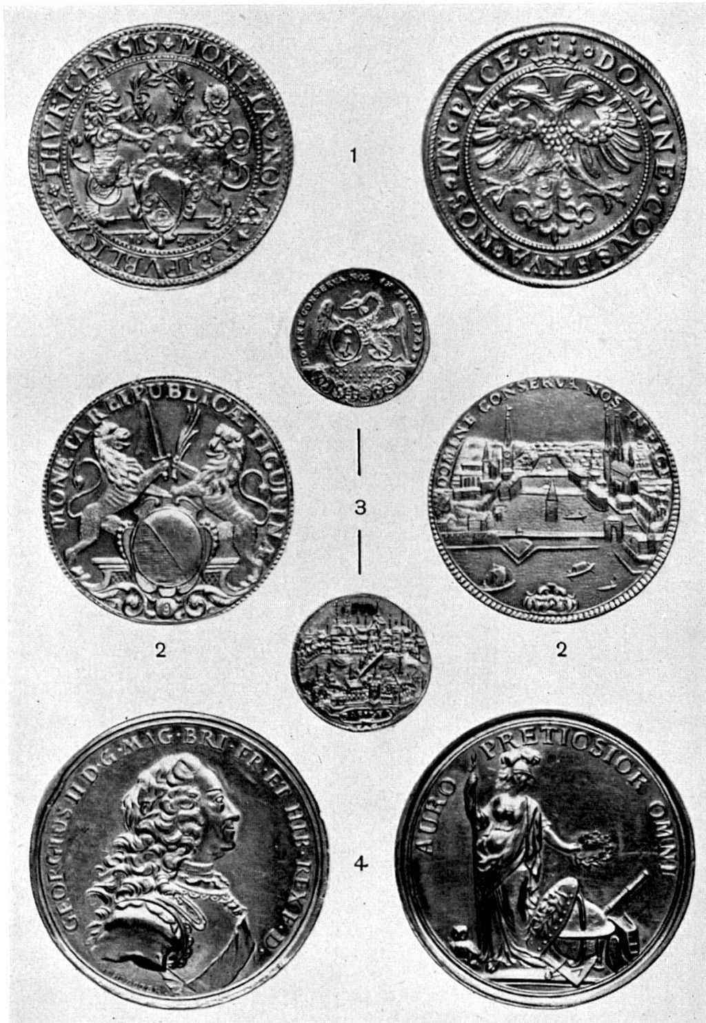
Abb. 23. 1. Zürich, 4 Dukaten 1640, Gold – 2. Zürich, 8 Dukaten 1723, Gold – 3. Basel, Dukat 1743, Gold – 4. J. M. Mörikofer, Medaille der Universität Göttingen, Gold. (S. 32 u. 34)