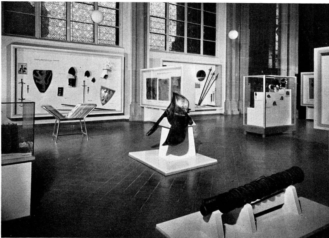
Abb. 24. Die Waffenhalle in der früheren (oben) und der neuen Aufstellung (unten). (S. 7)