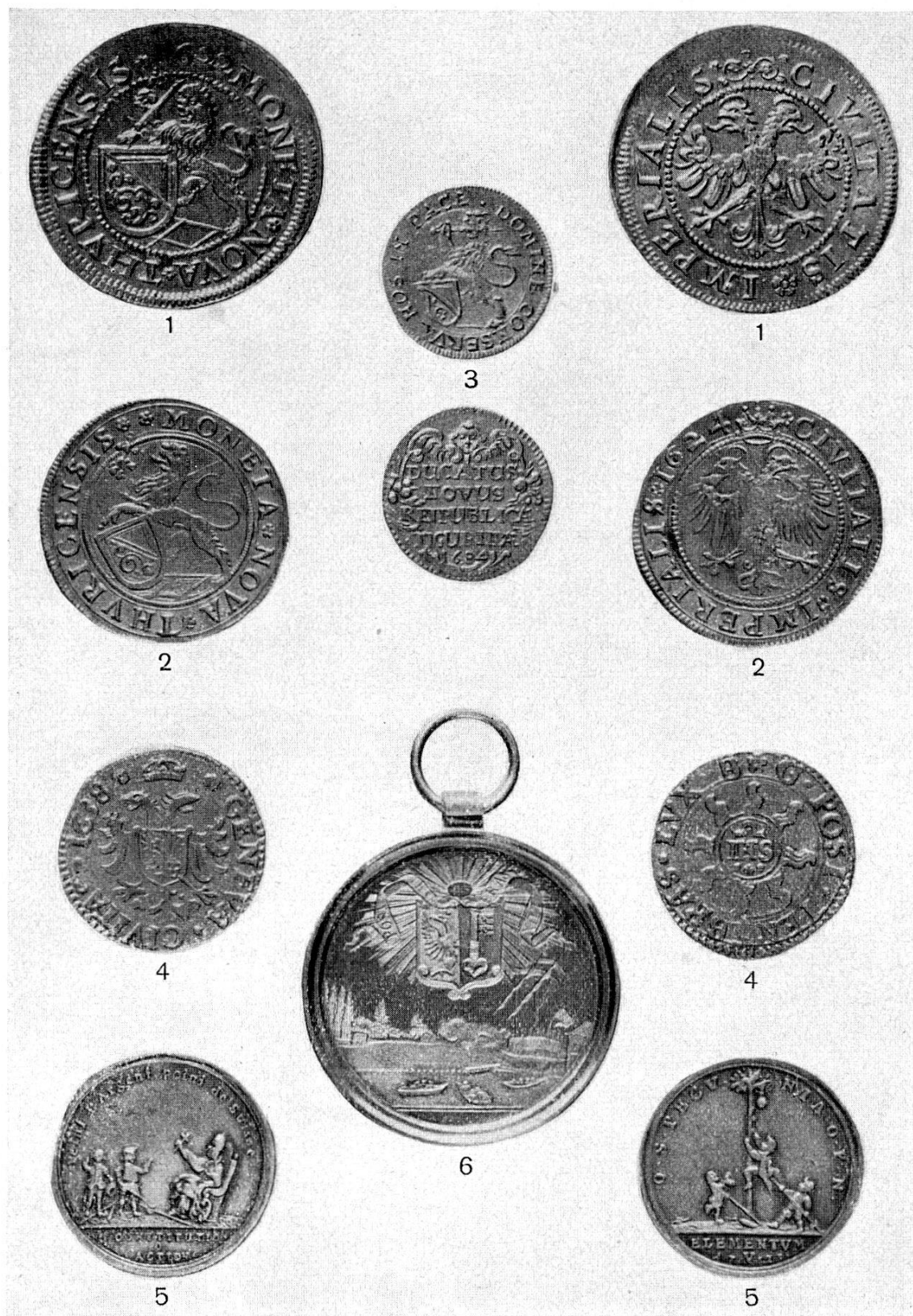
Abb. 54. 1950. 1. Zürich, 4 Dukaten 1622, Gold. 2. Zürich, Doppeldukat 1624, Gold. 3. Zürich, Dukat 1684, Gold. 4. Genf, Pistole 1638, Gold. 5. Spottjeton: Pas d'argent, pas de Suisses, Silber. 6. Genf, Preismedaille der Société de la Navigation, 1817, Gold. (S. 42—44)