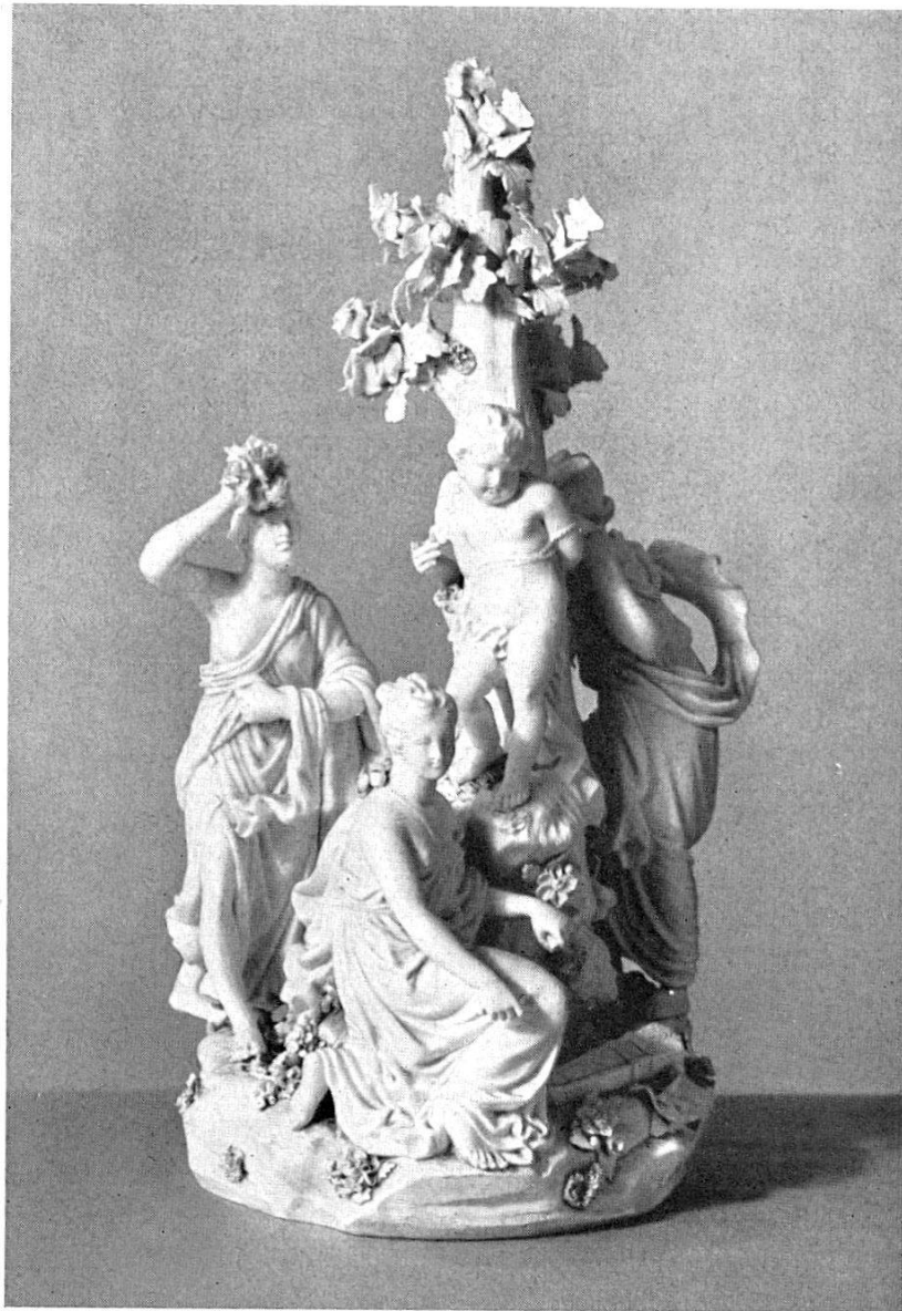
Abb. 44. 1949. Die 3 Grazien mit Amor, Biscuit, von J. J. W. Spengler, um 1780 (S. 31). Vgl. Abb. 45

St. Ursen, Holzhaus: 1 Negativ, Aussenansicht, 1903. Z