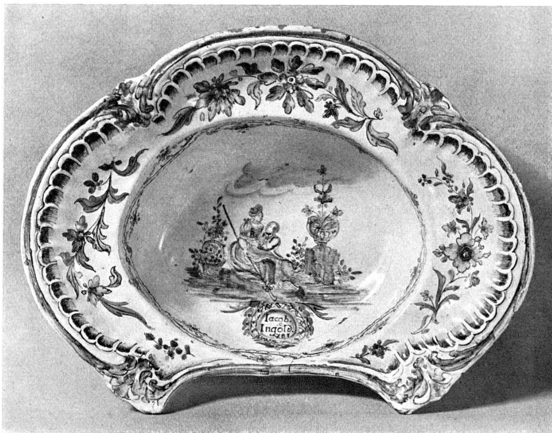
Abb. 46. 1949. Bartschüssel aus Fayence, von Jacob Ingold in Yverdon, dat. 1781. (S. 31)

Rovio, Kirchlein S. Vigilio, Restaurierung 1949: 4 Negative, Aussen- und Innenansichten, Wandgemälde.