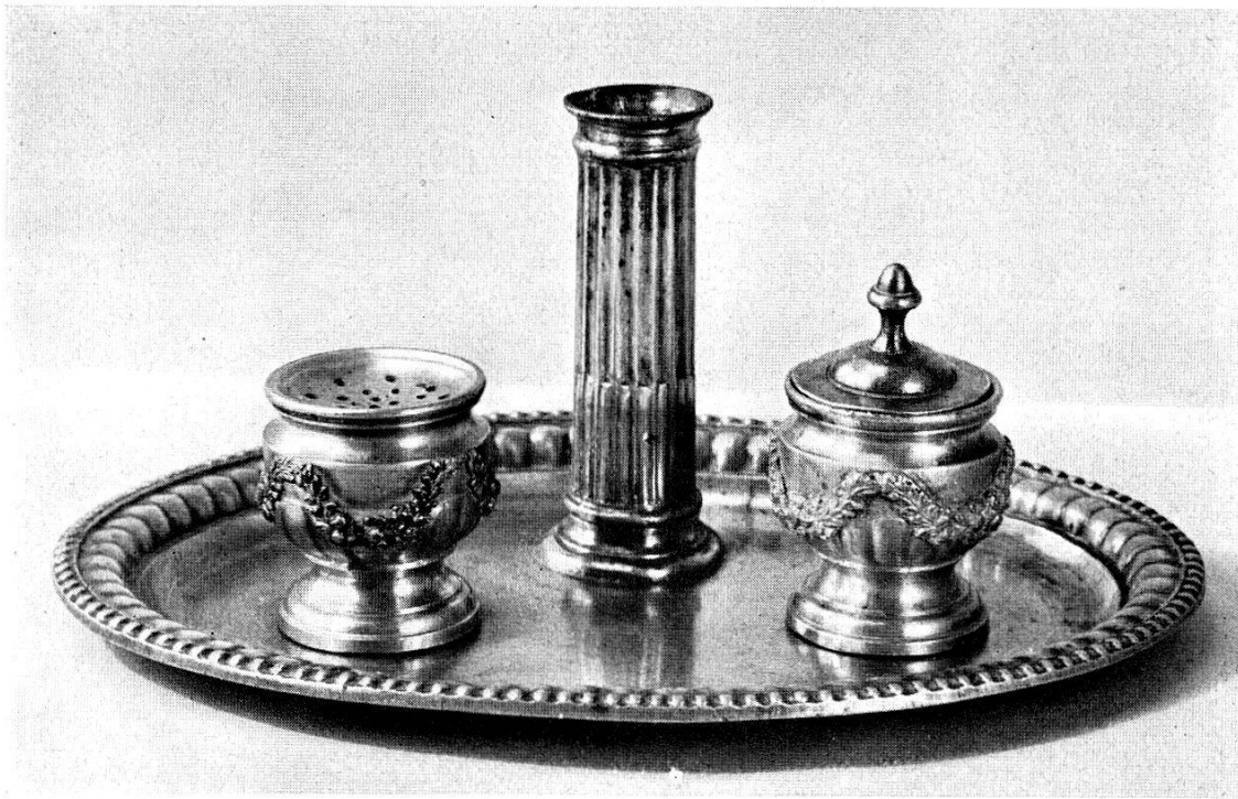
Abb. 48. 1949. Schreibzeug aus Zinn, von A. und S. Wirz zu Zürich, 18. Jh., Ende. (S. 40)