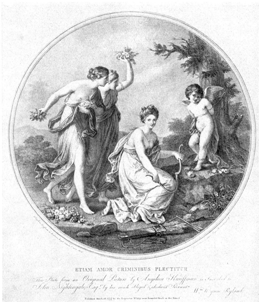
Abb. 45. Kupferstich von W. Wynne Ryland nach Angelika Kauffmann, 1777. Vorbild zu Abb. 44

St. Gallen, Kirche St. Mangen, archäologische Untersuchungen: 15 Pläne und Skizzen, sowie 36 Photographien zum Artikel «Untersuchungen in der St. Mangen-Kirche in St. Gallen», von Prof. Dr. E. Fiechter-Zol-