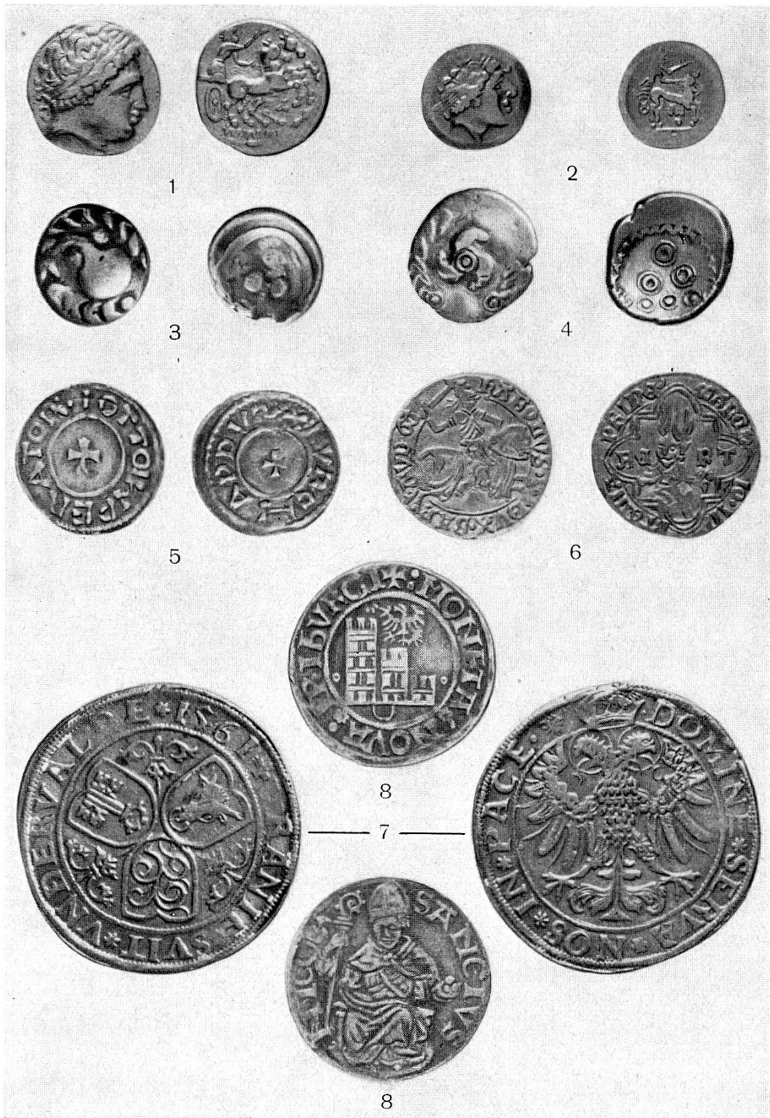
Abb. 53. 1950. 1. Helvetier, Stater, Gold. 2. Helvetier, Viertelstater, Gold. 3. Bojer, schüsselförmiger Stater, Silber. 4. Bojer, schüsselförmiger Stater, Gold. 5. Zürich, Denar Kaiser Ottos I. und Herzog Burkarts von Schwaben, Silber. 6. Savoyen, Herzog Karl I., Dukat o. J., geprägt in der Münzstätte Cornavin, Gold. 7. Uri, Schwyz u. Unterwalden, Taler 1561, Silber. 8. Freiburg, Dicken o. J., Silber. (S. 41—43)