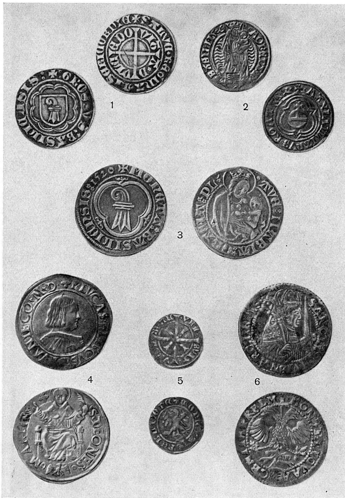
Abb. 51. 1949. 1. Basel, Turnosgroschen (um 1499), Silber. 2. Basel, Goldgulden 1506. 3. Basel, Halbdicken 1520, von Urs Graf, Silber. 4. Messerano, Testone (Imitation eines Testons des Bistums Lausanne), Silber. 5. Uri-Schwyz-Unterwalden, Mezzo grosso tirolino von Bellinzona, Silber. 6. Oberital. Münzstätte, Testone (Imitation eines Dickens von Uri), Silber. (S. 42 und 44)