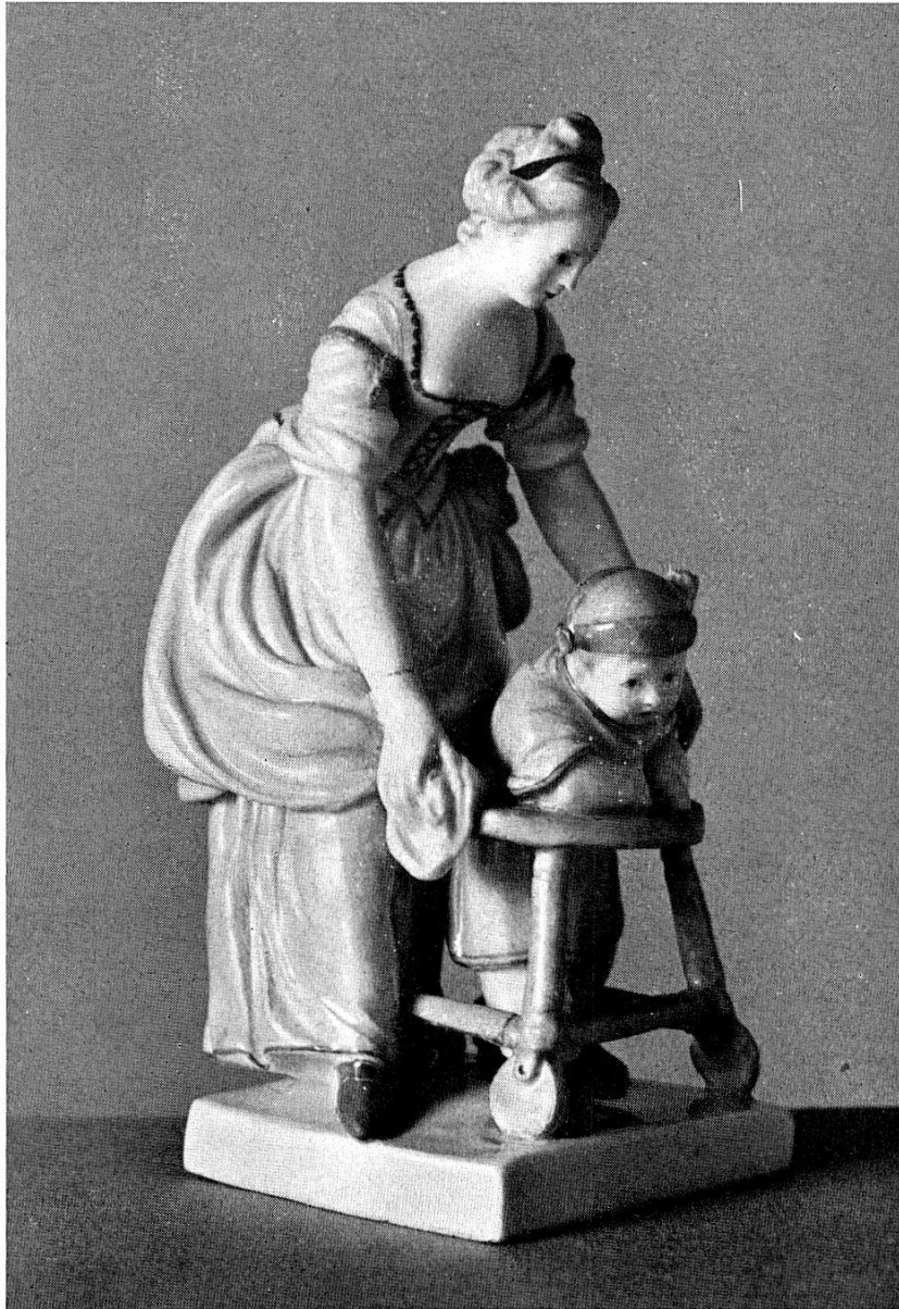
Abb. 42. 1950. Mutter mit Kind im Laufstuhl, Zürcher Porzellanfigur, um 1770/80. (S. 30)

Basel, Fischmarkt mit -Brunnen: 1 Photographie, Ansicht um 1900 (Messbildaufnahme). Dep.