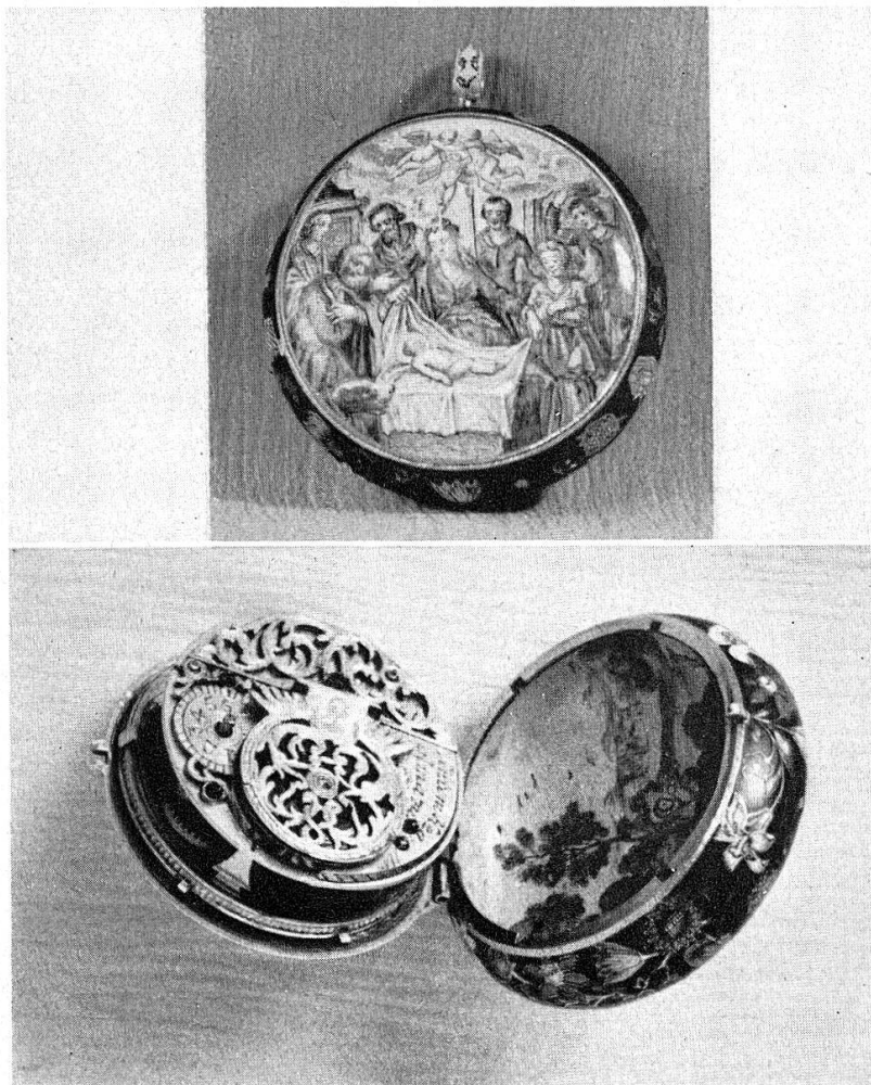
Abb. 18. Goldene Taschenuhr mit Emailmalerei, von Anton Hegglin zu Zug, 18. Jahrh., Anfang. (S. 24)

zum romanischen Altar 1 : 10; 2 kolor. Zeichnungen der Säulen; 14 Photographien, Teilaussenansichten, Hauptportal zum Konventbau, Chorgestühl und Malereien an den Schiffspfeilern; 3 Negative, Portal an der Gar-