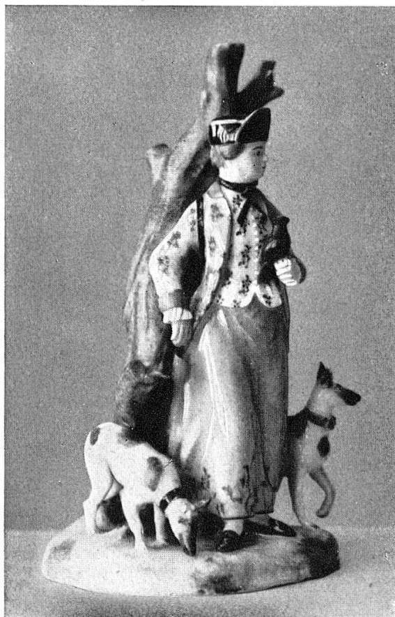
Abb. 20. Jägerin, Zürcher Porzellanfigur, um 1770. (S. 21)

positive nach obigen Negativen; 1 «Bericht über die Restaurierung des Schlosses Beromünster in Beromünster und dessen Umbau in ein Heimatmuseum, 1939-1947», verfasst vom bauleitenden Architekten V. Fischer, Luzern, 1947.