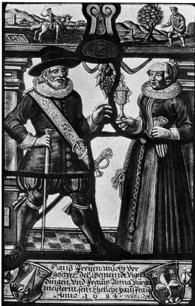
Abb. 15. Allianscheibe des Hans Freienmuth-Bürgermeister, von Wolfgang Spengler zu Konstanz, dat. 1684. (S. 22)

Für die prähistorische Abteilung wurden vom Atelier des Landesmuseums folgende Kopien hergestellt: Abguss einer Michelsberger Scherbe vom Lut-