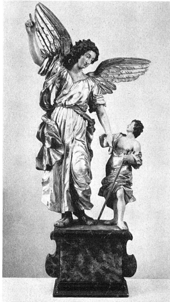
Abb. 14. Tobias und der Engel, Lindenholz. Wohl von C. Tüfel zu Sursee, 17. Jahrh., 2. Hälfte. (S. 28)

Glasgemälde im Handel und in Privatbesitz, kirchliche Goldschmiedearbeiten in Bremgarten, Glarus, Rheinau, Schwyz, Steinen und Uznach, weltliche in Luzerner und Zürcher Besitz, sowie von der Inful von Kreuzlingen im