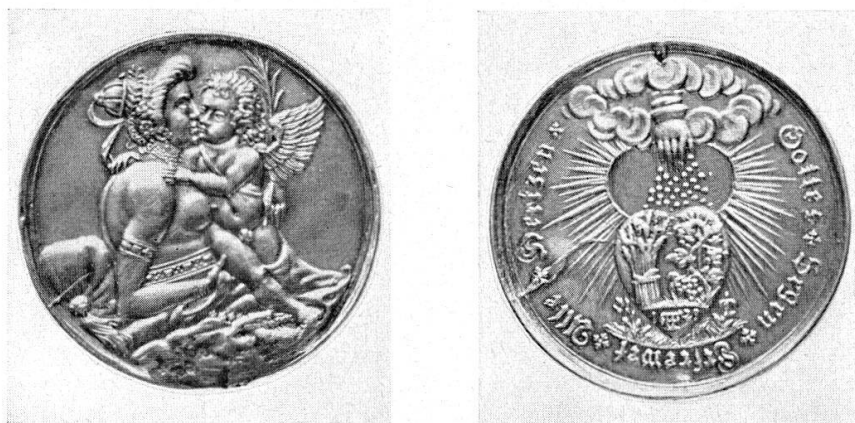
Abb. 23 Ehepfennig von Friedrich Fecher, 1629. (S. 29)

Sollte einmal doch der ersehnte Zustand eintreten, daß die Schätze des Münzkabinetts in einem eigenen, genügend großen Raum den Besuchern des Landesmuseums vorgeführt werden können, so wird der Münzfund von Überstorf als geld- und münzgeschichtlich, aber auch als allgemeines geschichtlich interessantes Monument dort einen wichtigen Platz einnehmen: als — ich möchte sagen — lebendiges Anschauungsmaterial, das mithelfen wird, in allen Kreisen der Bevölkerung die Bedeutung von Münzfunden für die geschichtliche Erkenntnis ins Bewußtsein zu rufen.