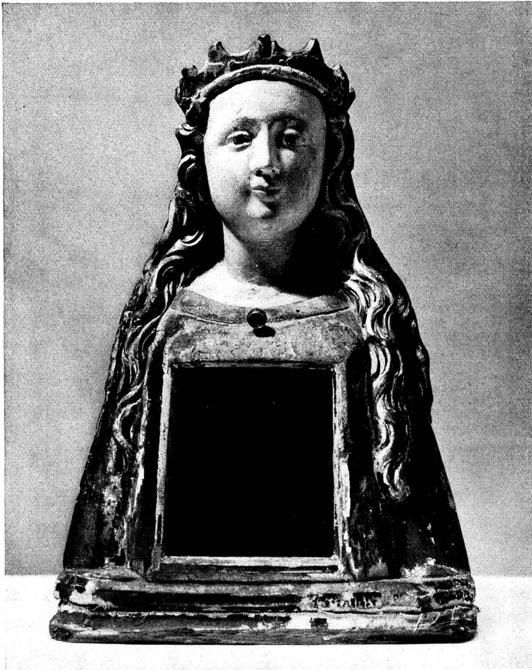
Hölzerne Reliquienbüste einer unbekannten Heiligen Aus Cumbels (Kt. Graubünden). 15. Jh. 2. H.