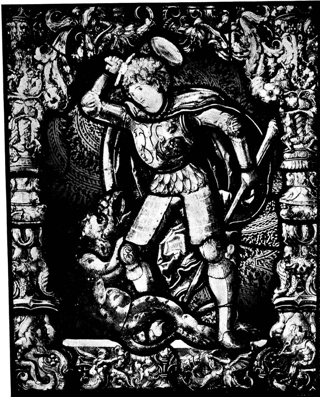
St. Georg im Kampf mit dem Drachen Vermutlich Arbeit des Glasmalers Lukas Schwarz in Bern, um 1520