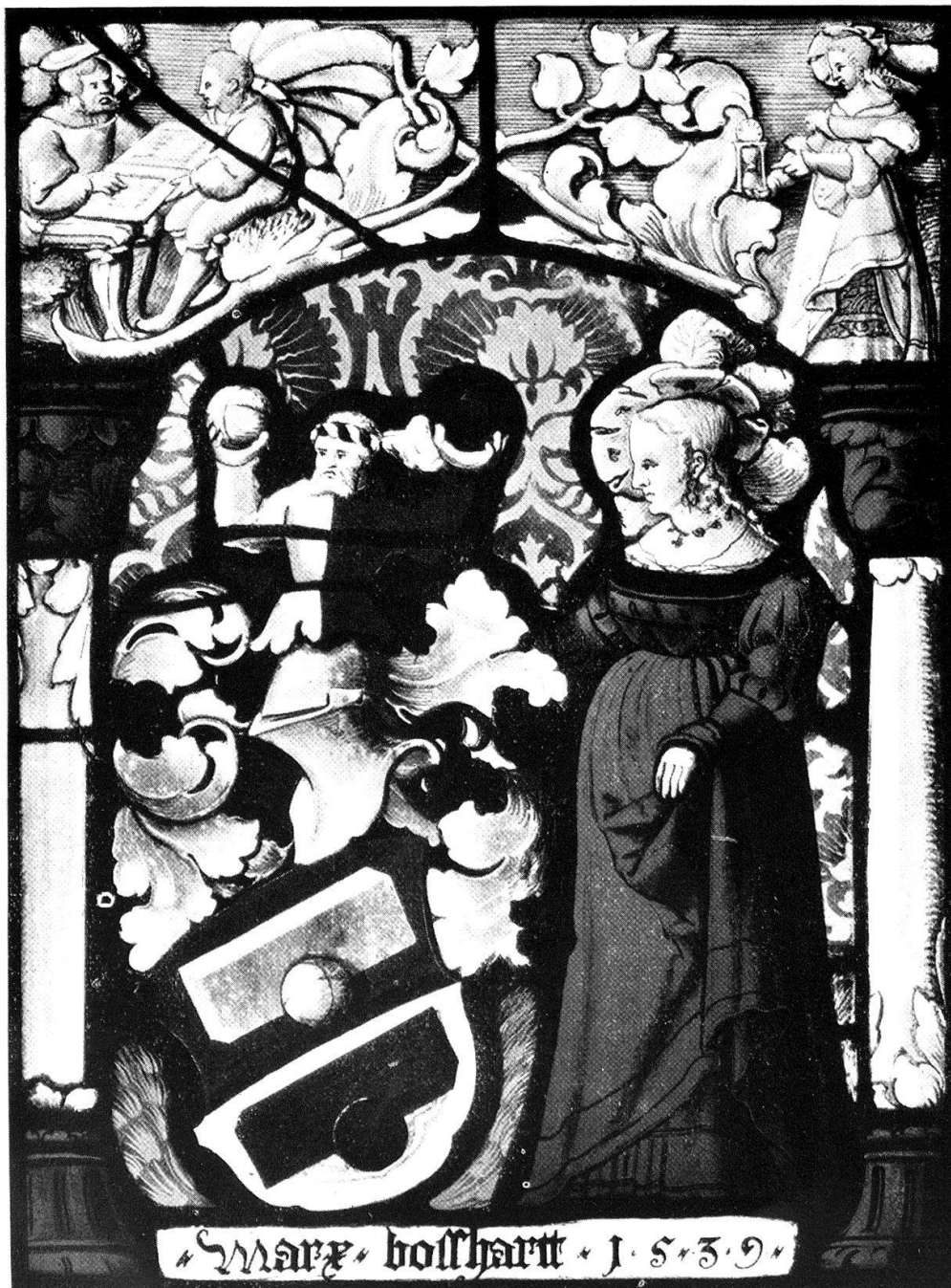
Wappenscheibe des Marx Bosshart von Zollikon. Arbeit des Rudolf Bluntschli von Zürich, 1539.