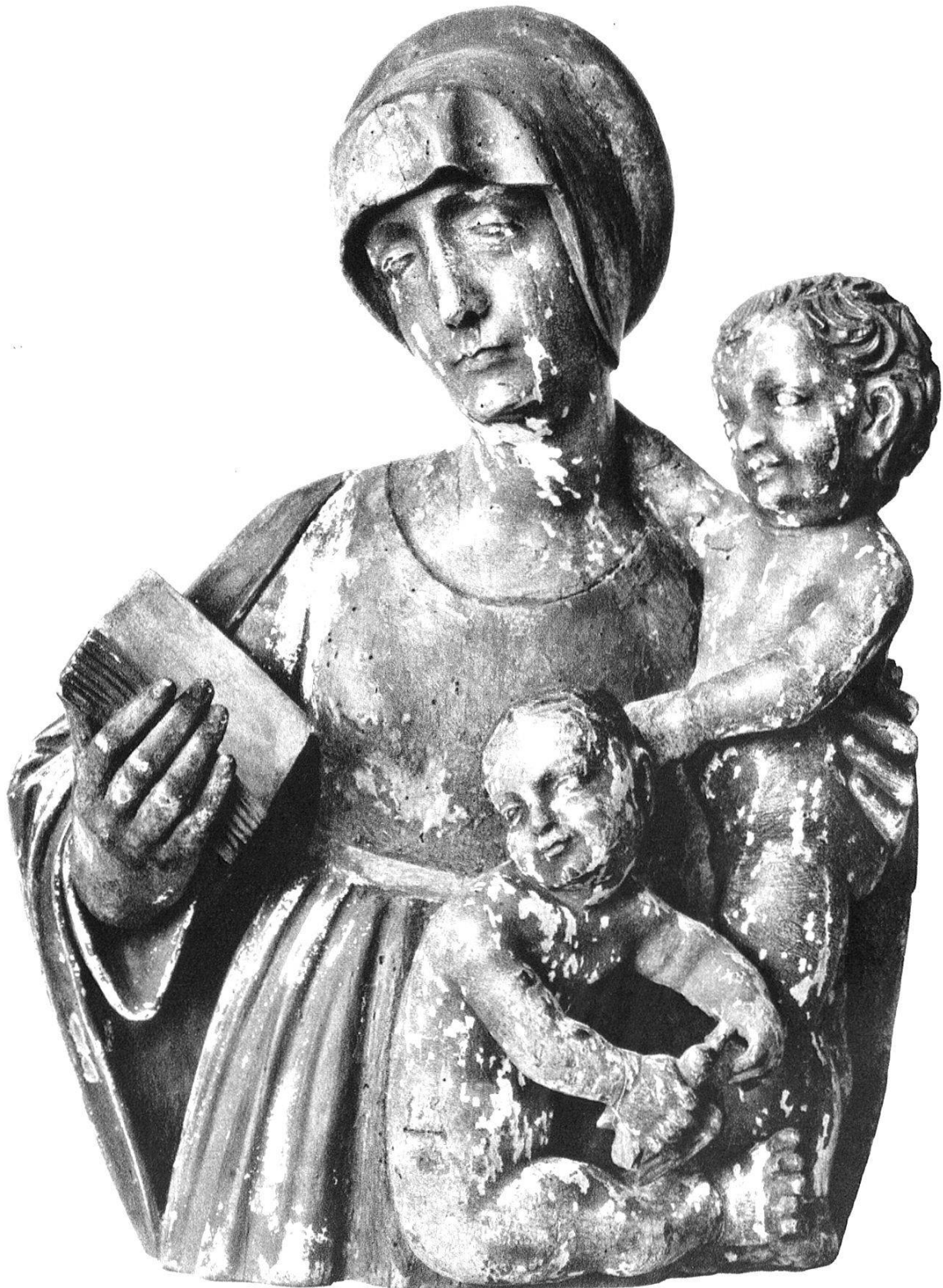
Maria mit dem Jesusknaben und dem kleinen Johannes.