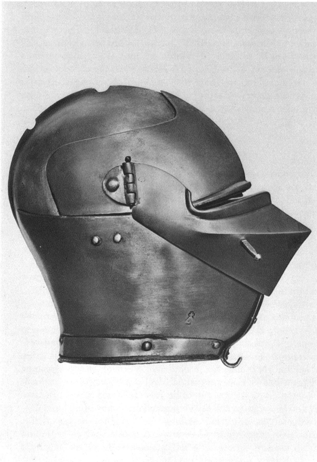
Visierhelm aus der Werkstatt der Missaglia in Mailand. Mitte 15. Jahrhundert.