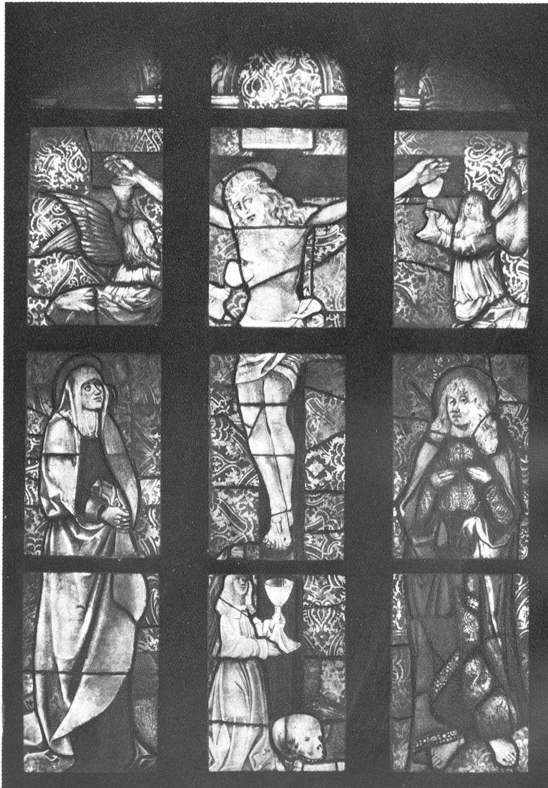
Kirchenfenster aus der Schlosskapelle von Greng (Kt. Freiburg). Um 1500.