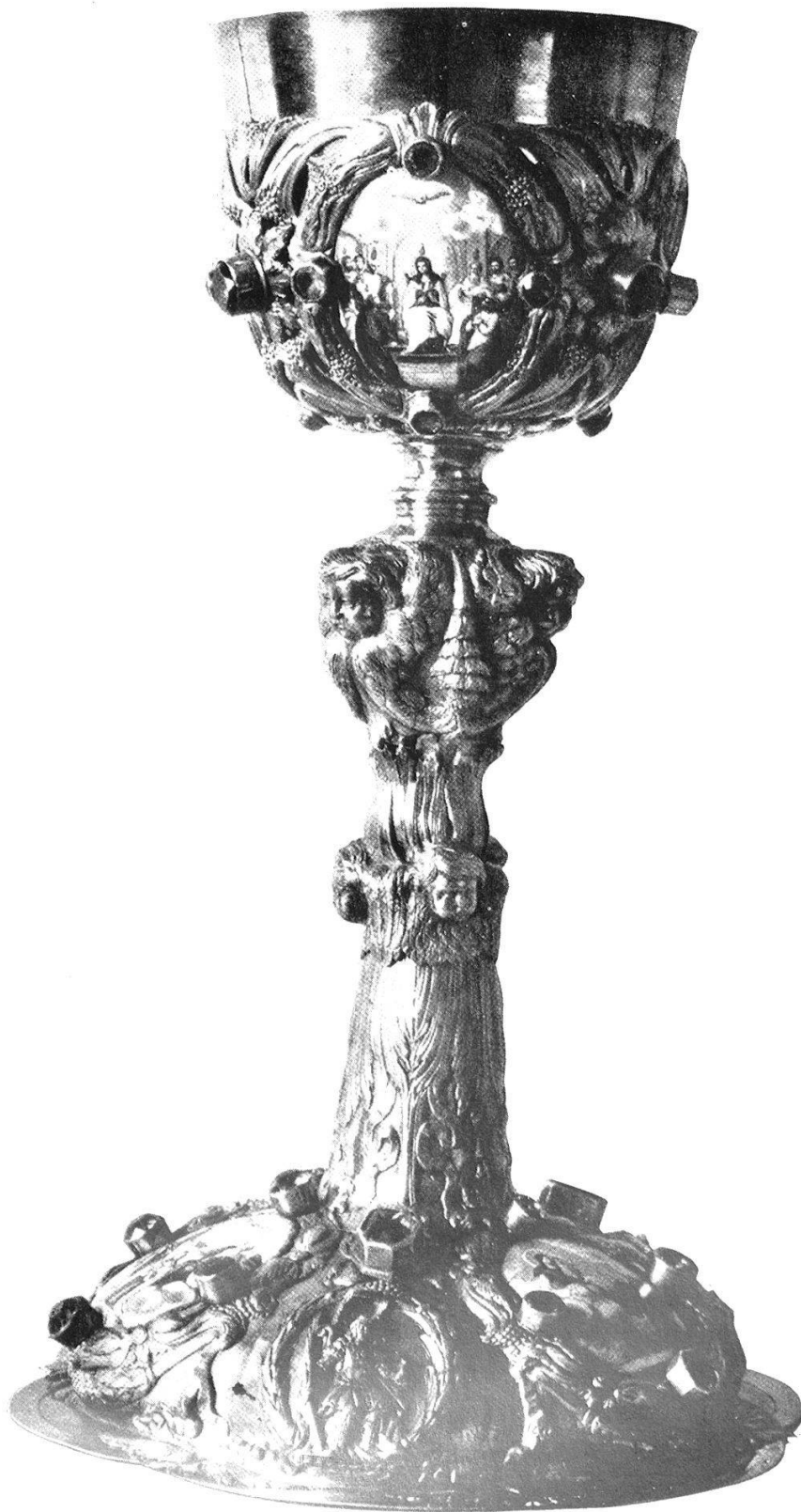
Abb. 17. Silbervergoldeter Speisekelch von Heinrich Dumeisen, 17. Jahrhundert.