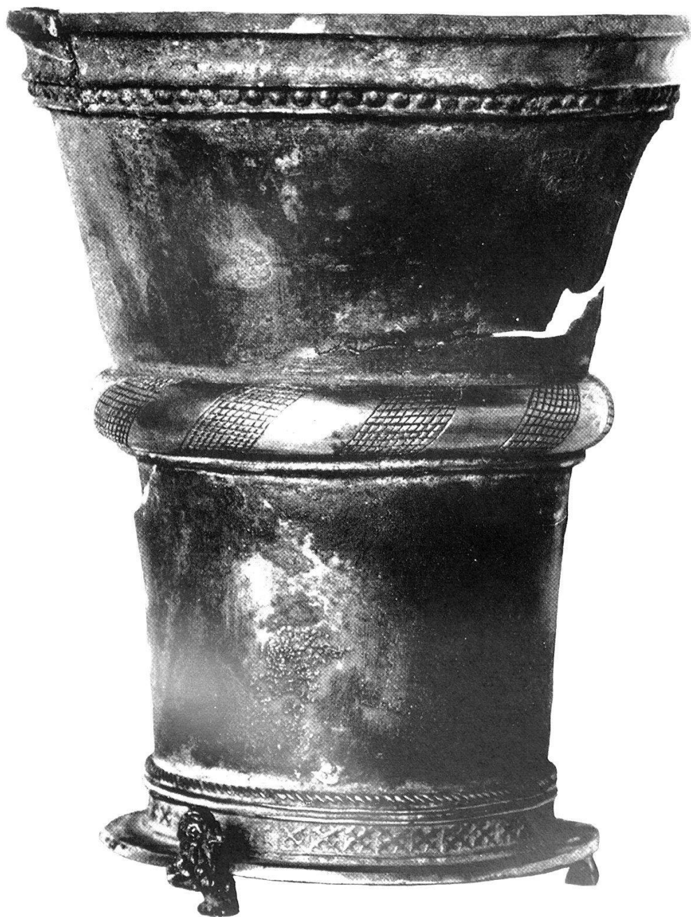
Abb. 14. Silberner Becher, vermutlich aus dem Besitze Herzog Karls des Kühnen. Burgundische Arbeit. 15. Jahrhundert.