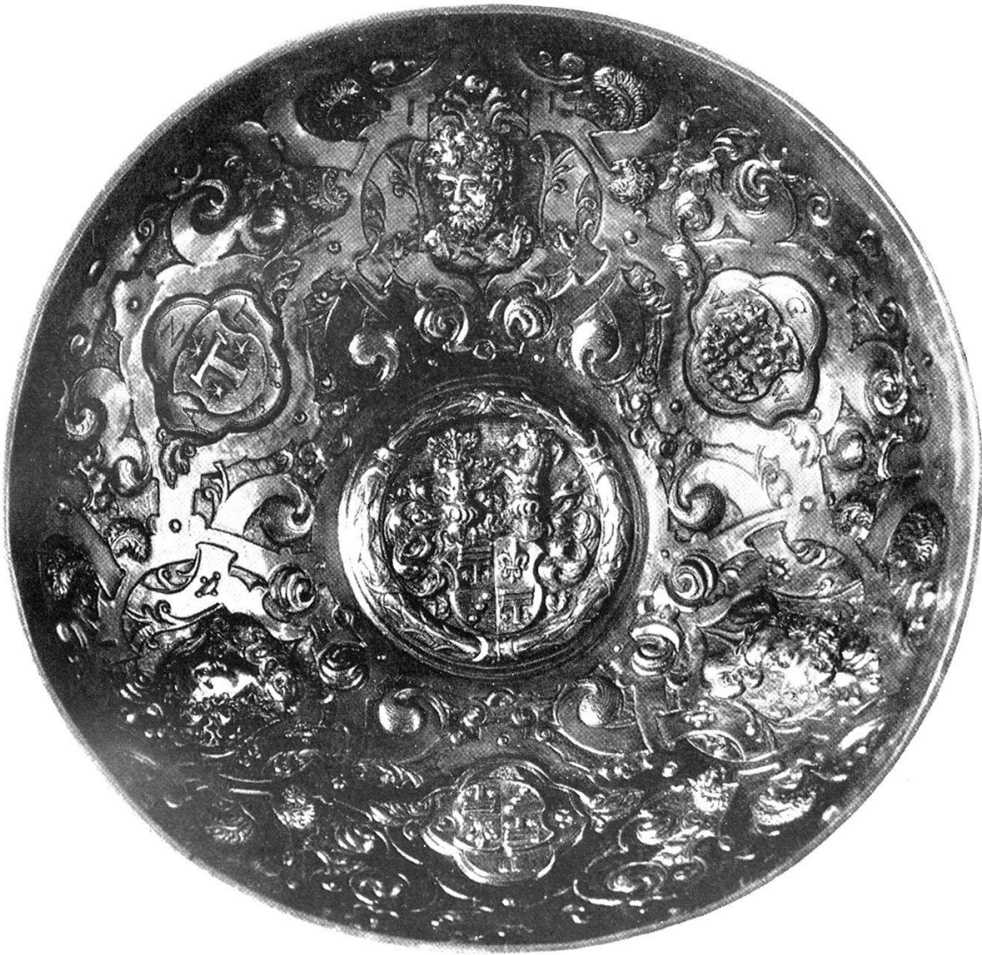
Abb. 16. Silbervergoldete Trinkschale aus dem Wallis. (Innenansicht.)