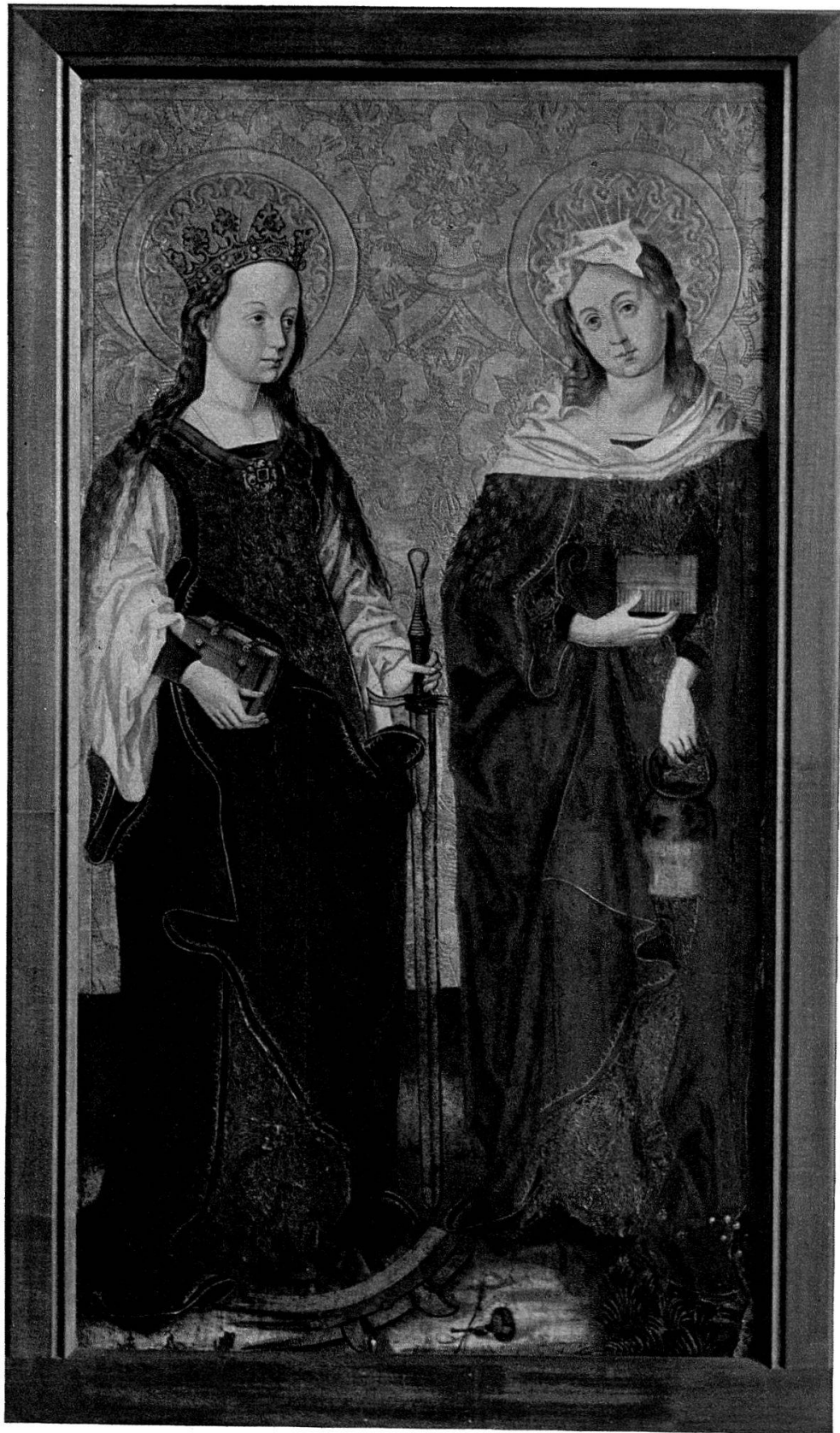
Altarflügel mit Darstellung der Heiligen Verena und Katharina, Anfg. 16. Jahrh.