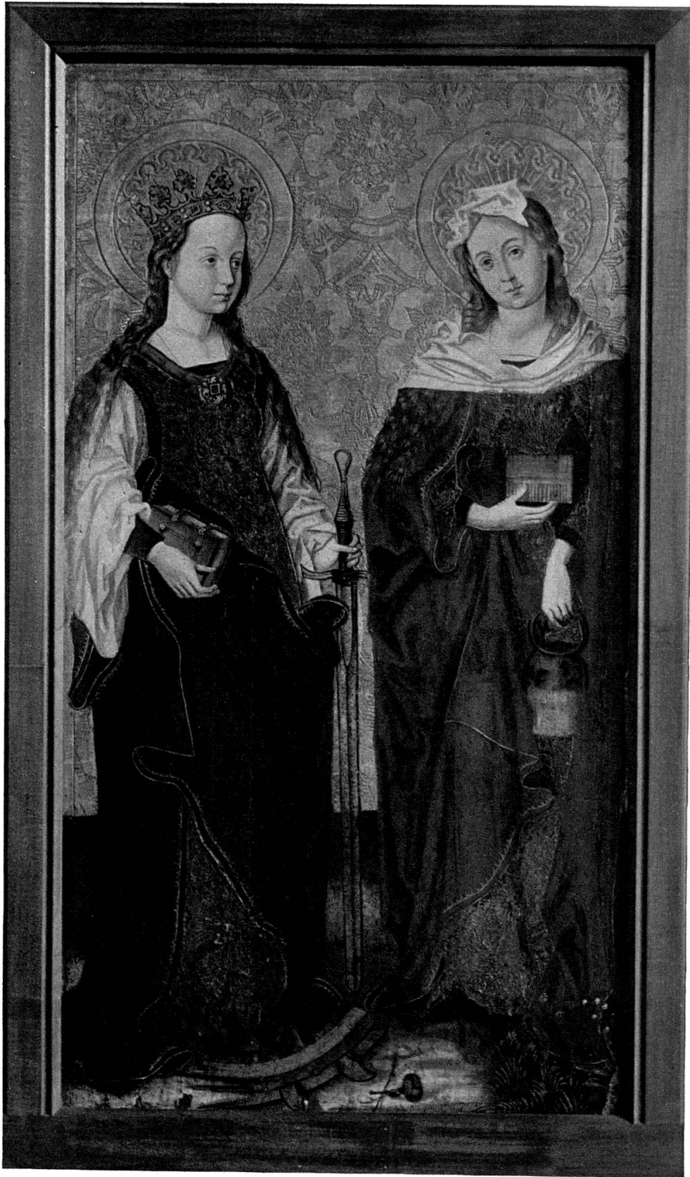
Altarflügel mit Darstellung der Heiligen Verena und Katharina, Anfg. 16. Jahrh.