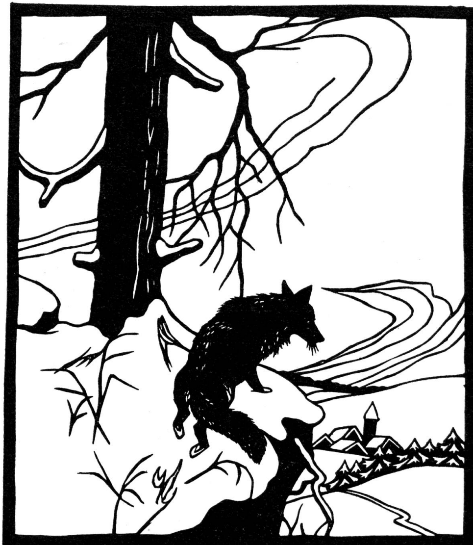
Die harte Zeit