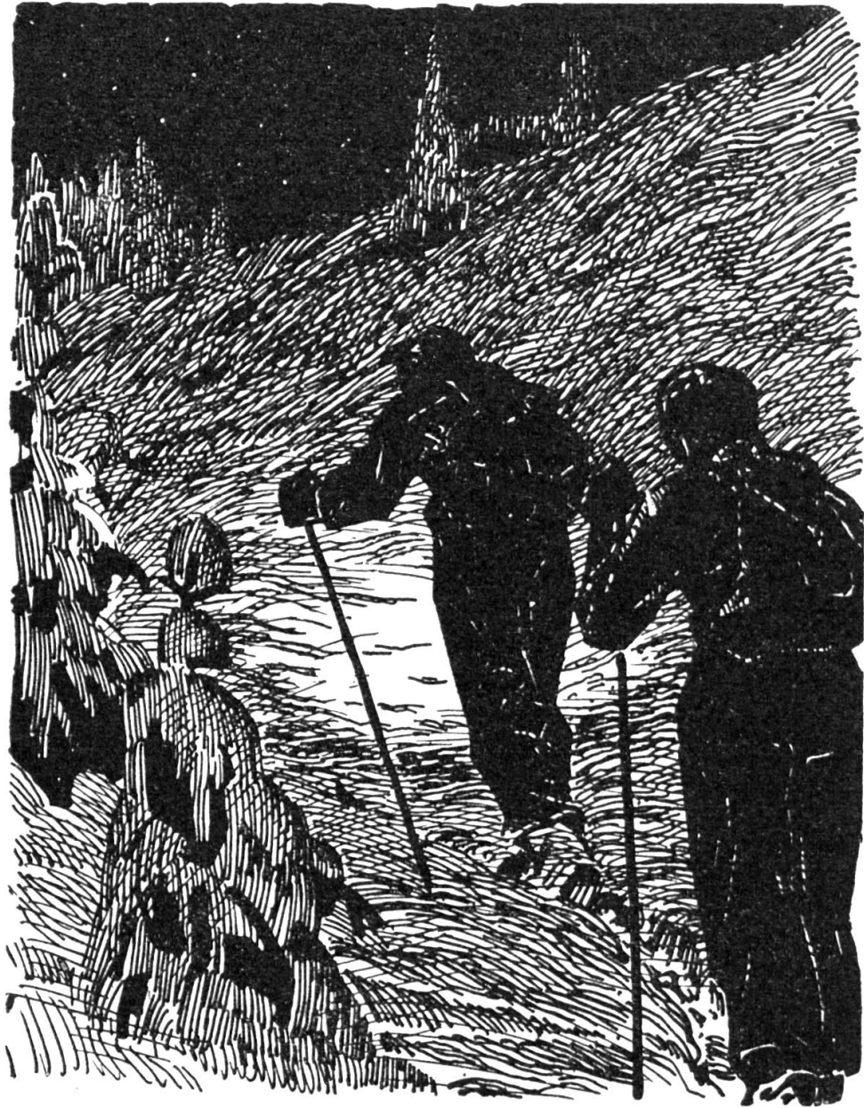
Aufstieg zur Hütte