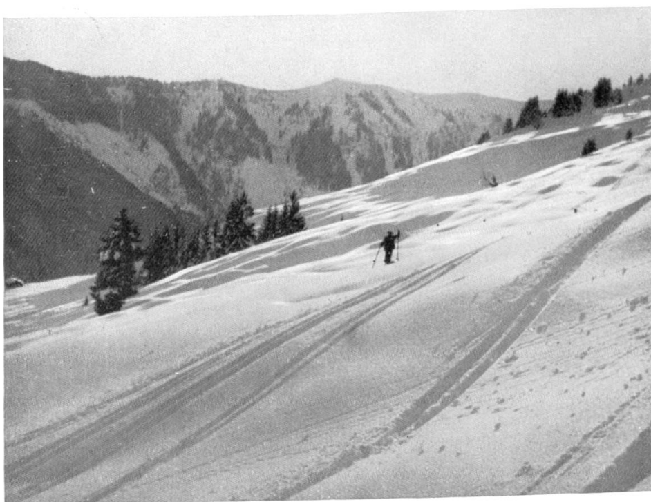
Skiberge um Saalbach: Abfahrt vom Zwölferkogel nahe der Akademikerhütte