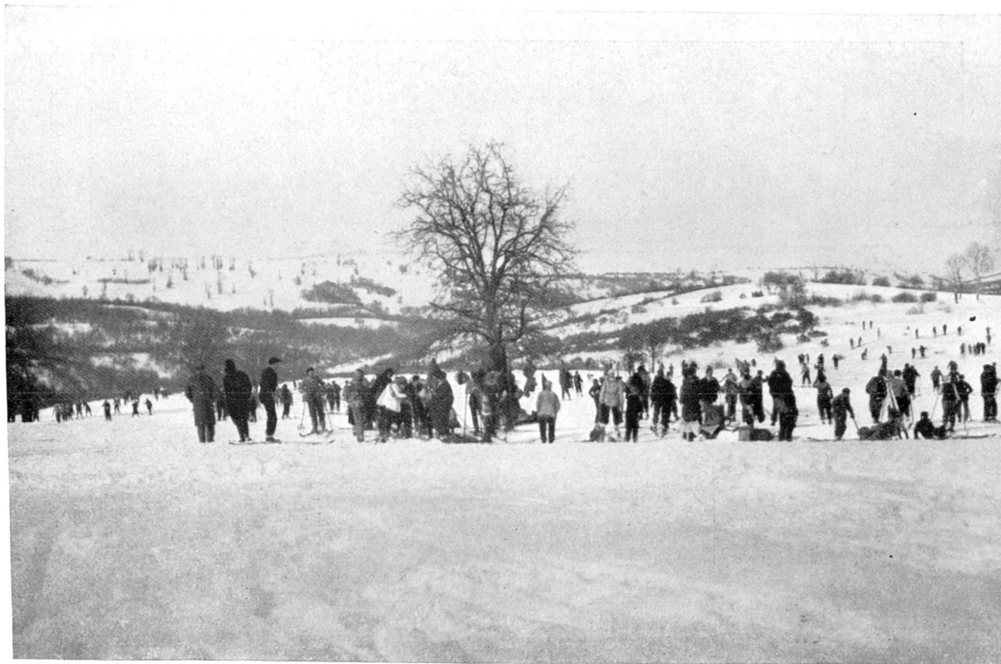
Ski en Bulgarie : Vue à l'Allin à 4 heures de l'après-midi. (Voir l'article page 48)