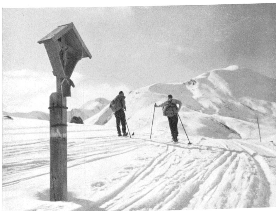
Skiberge um Saalbach: Am Gipfelkamm des Schattberges