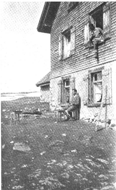
Zwei, die sich sonnen