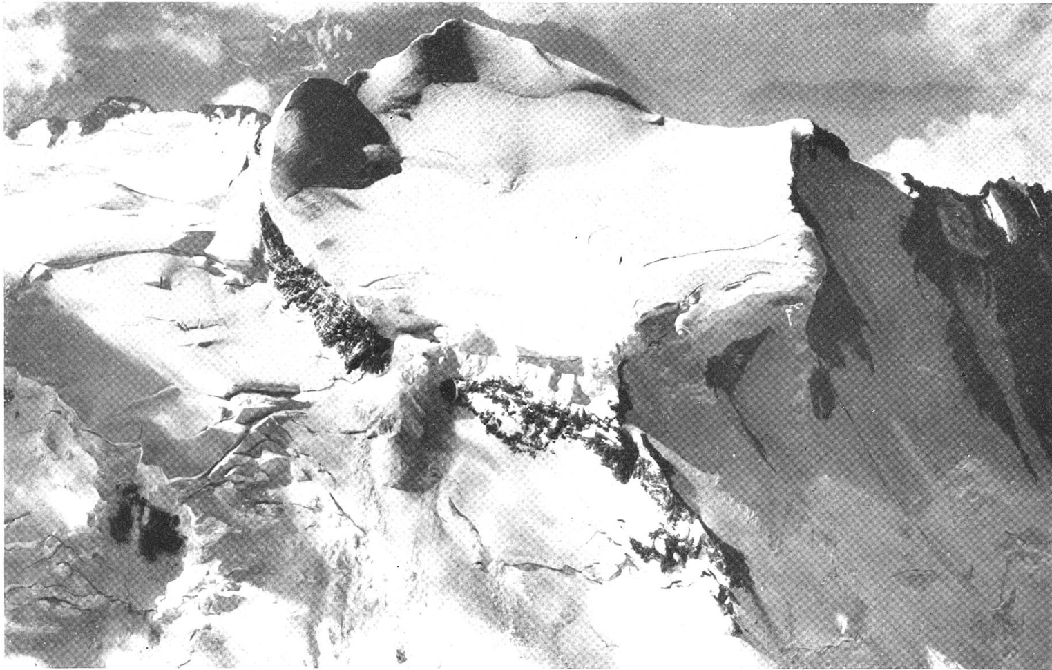
Sommets du Grand Gombin avec Corridor et Mur de la Côte (zum Artikel von Marcel Kurz) Walter Mittelholzer