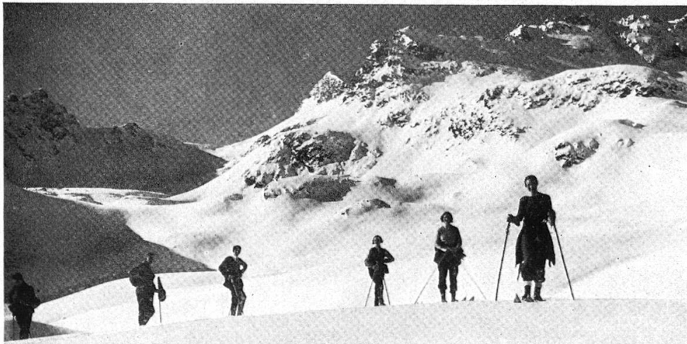
Corviglia : Aufstieg zu Fuorcla Piz Ot