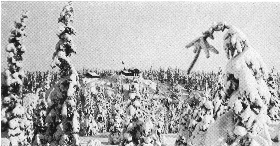
Oslo. Skiheime in norwegischer Waldlandschaft