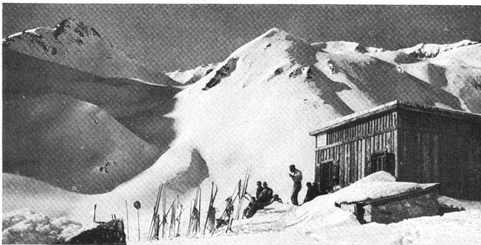
Corviglia : Suvretta-Hütte mit Piz Julier