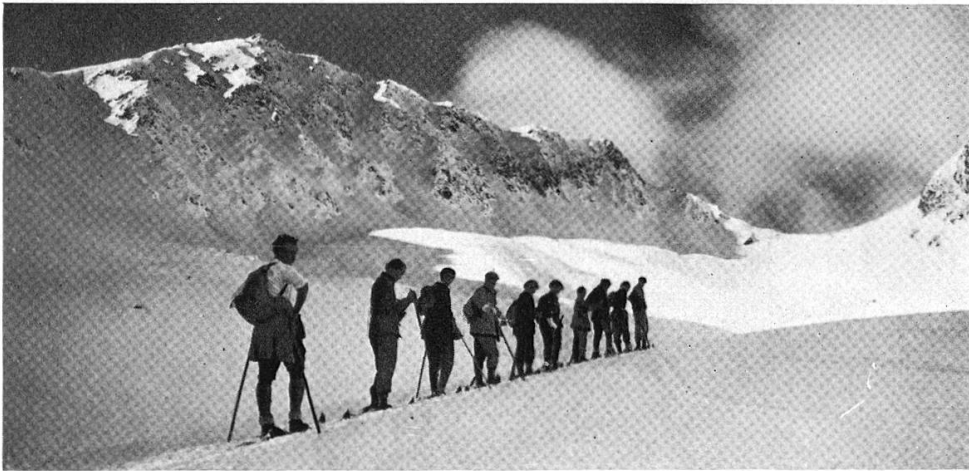
Corviglia : Aufstieg zur Fuorcla Schlatain (Piz Nair)