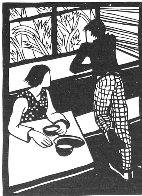
Wunder der Eisblume

Les hommes par contre sont flattés. Plus grands dans leur costume de sport, plus forts, plus viriles. Et ils le savent bien! Fuir la ville, le brouillard! Il semble qu'à cette seule perspective les cœurs se dilatent, l'esprit s'aère, que tout notre être enfin se vivifie, avide d'aspirations saines et vraies. J'aime-