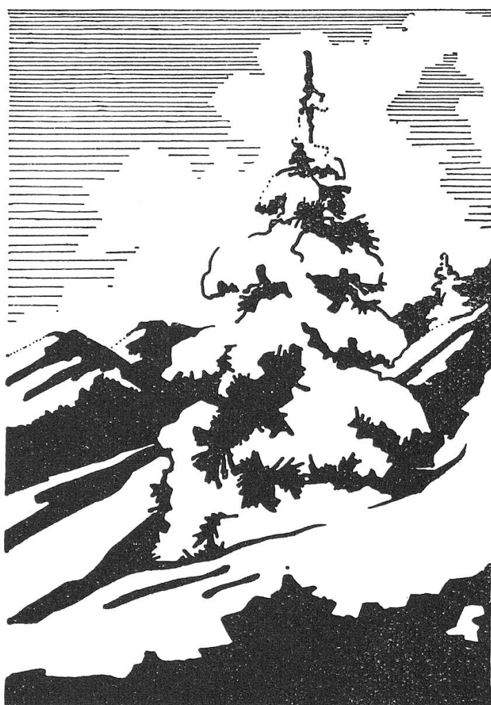
Winter im Jura