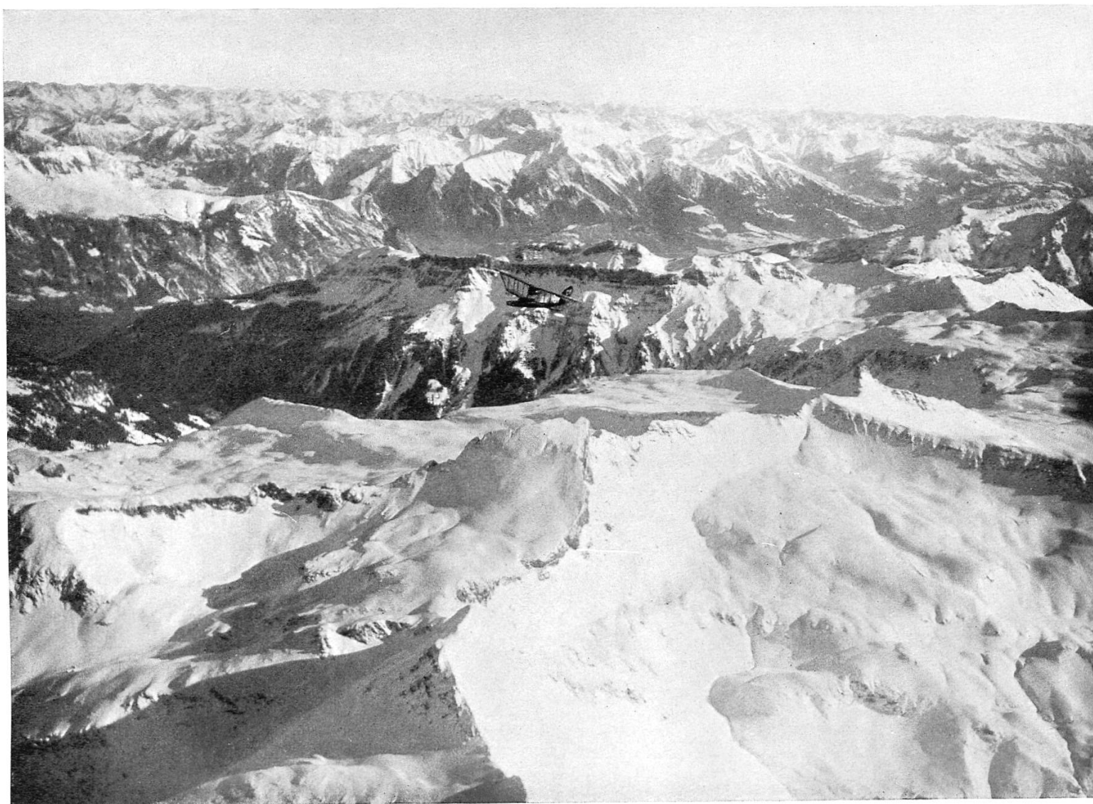
Fliegeraufnahme der Ad Astra, Zürich Weissmeilen, Spitzmeilen; Schils- Seez- und Rheintal. Im Hintergrund Scesaplana; von W. 4000 m.