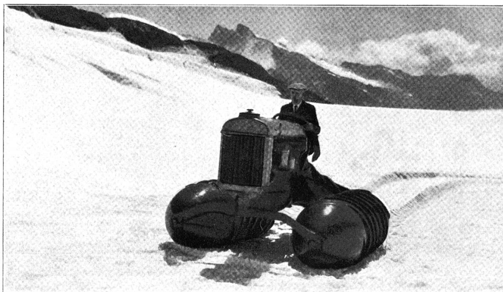
Der Schneetraktor auf dem Jungfraufirn.