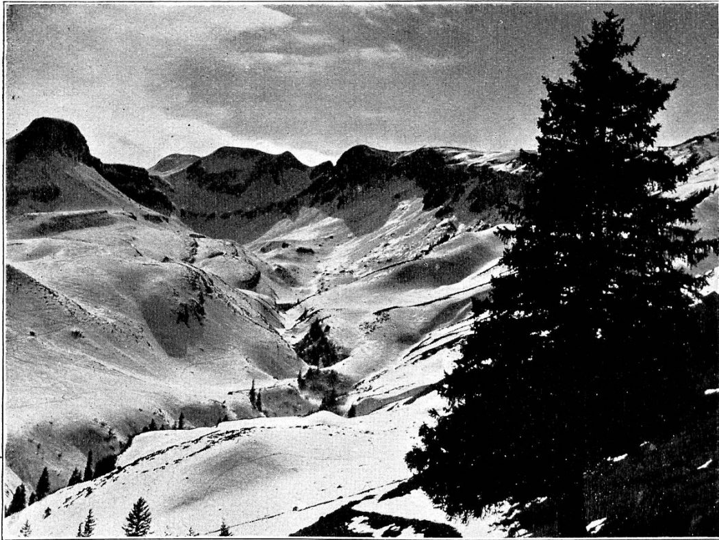
Schluchiberg und Lauchernköpfl.