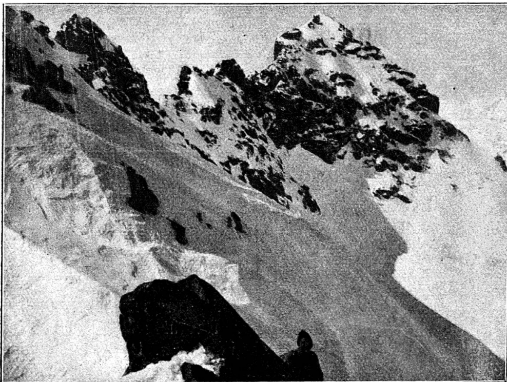
Mittelgrat und Piz Kesch.