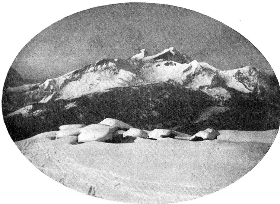
Mägisalp et Schwarzhorn.

Que ceux qui ne connaissent pas ou que de nom la vallée du Hasli, viennent personnellement se rendre compte de ses beautés et de ses richesses hivernales, qui ne le cèdent en rien à celles de l'été.