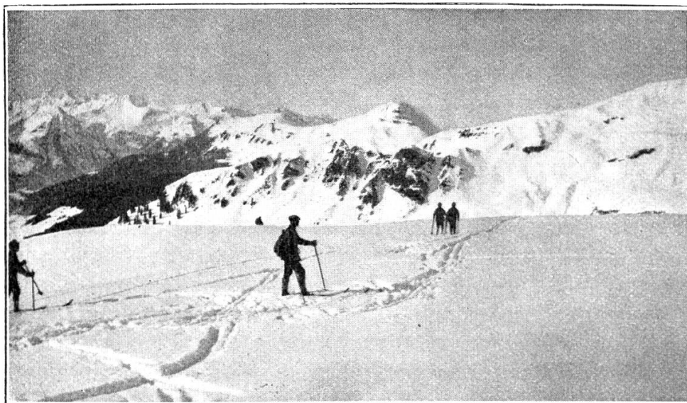
En route pour Planplatte.