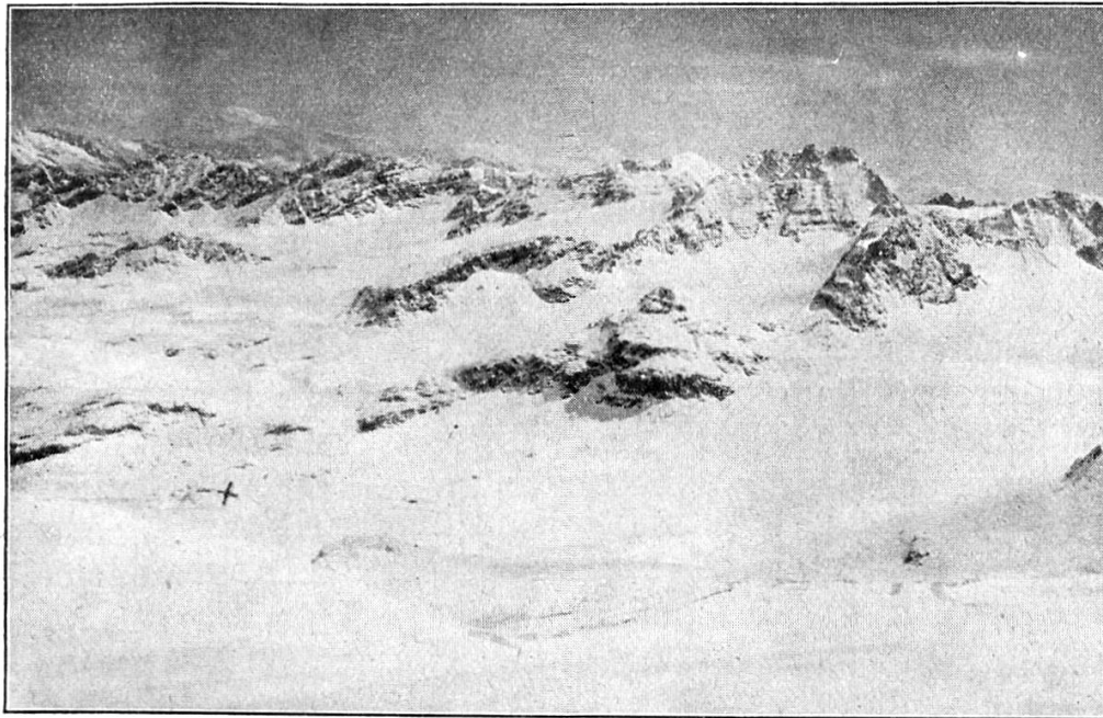
Gegend der Wiesbadenerhütte D. und Oe. A.-V.

der Passhöhe entgegen. Von dem ersteren sieht man natürlich nichts, denn alles ist tief eingeschnitten. Auf der Passhöhe selbst (3013 m) geniesst der Wanderer bei klarem Wetter ein Schauspiel von nie geahnter Pracht und Schönheit. Der grosse und kleine Buin, Piz Fliama, Verstanklahorn, grosser Litzner u. a. m. zeigen sich dem trunkenen Auge in ihrer ganzen, majestätischen Grösse. Auf dem