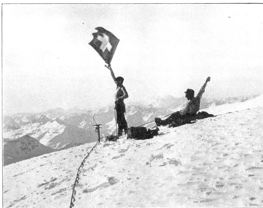
Auf dem Gipfel der Königsspitze.

Nach unseren Erlebnissen vom vorigen Tage wird man meinen, dass wir in dieser Höhe von 3857 m ü. M. nun erst recht an die Nase gefroren hätten. Doch nein, dem war nicht so. Im Schatten zeigte zwar unser Thermometer — 10 Grad, aber dabei schien die Sonne in solcher Pracht und Herrlichkeit auf uns hernieder, dass ich nicht widerstehen konnte, mich in ihren Strahlen zu baden. — Ich will nicht beginnen, alle die Berge aufzuzählen, die wir von unsrer hohen Warte überblicken konnten. Nur eins sei erwähnt, als wir im Norden und Westen wieder unsere alten, bekannten Schweizerberge erblickten, da flatterte unsere