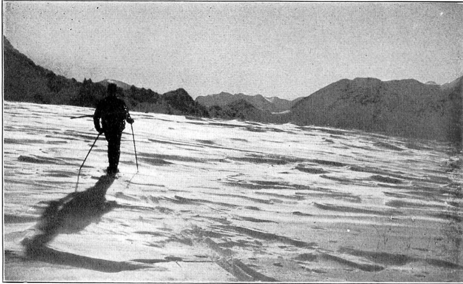
Auf der Vedretta del Zebrù.