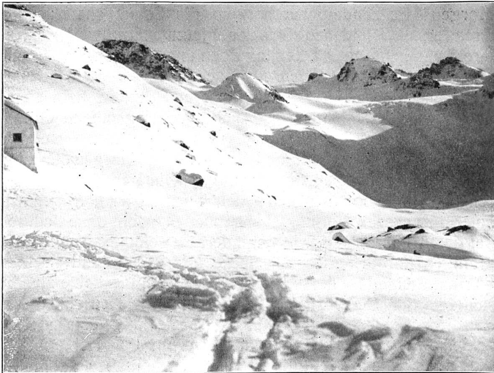
Abend bei der Jamhütte.