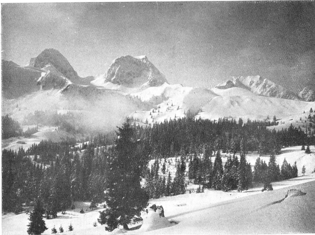
Nüenen, Gantrisch, Bürglen, Ochsen.

Heute ist der Schnee ordentlich, und wir gelangen mühelos hinauf. Wir sind überwältigt von der tadellosen Aussicht. Nur skizzieren möchte ich sie: Jura-Emmental-Pilatus-Schreckhorn - Jungfrau - Aletschhorn - Blümlisalp - Bietschhorn - Dent Blanche - Wildstrubel - Diablerets - Freiburgeralpen.