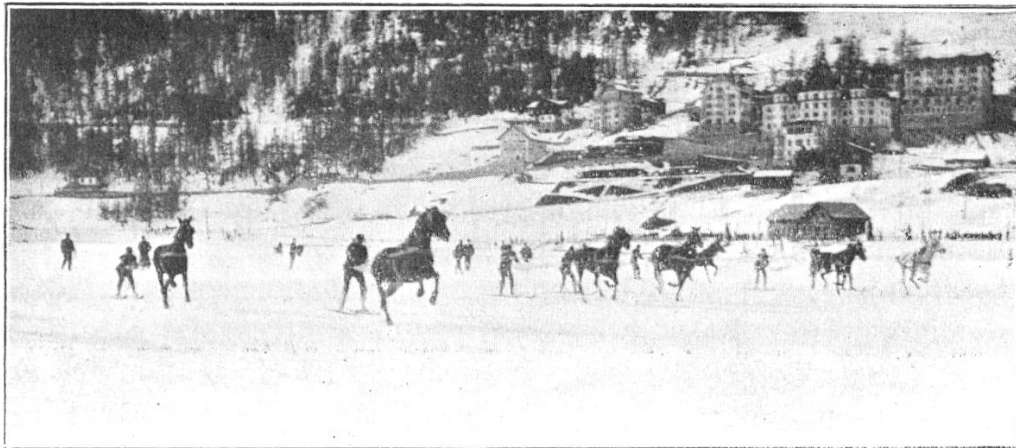
W. K pfer, phot.