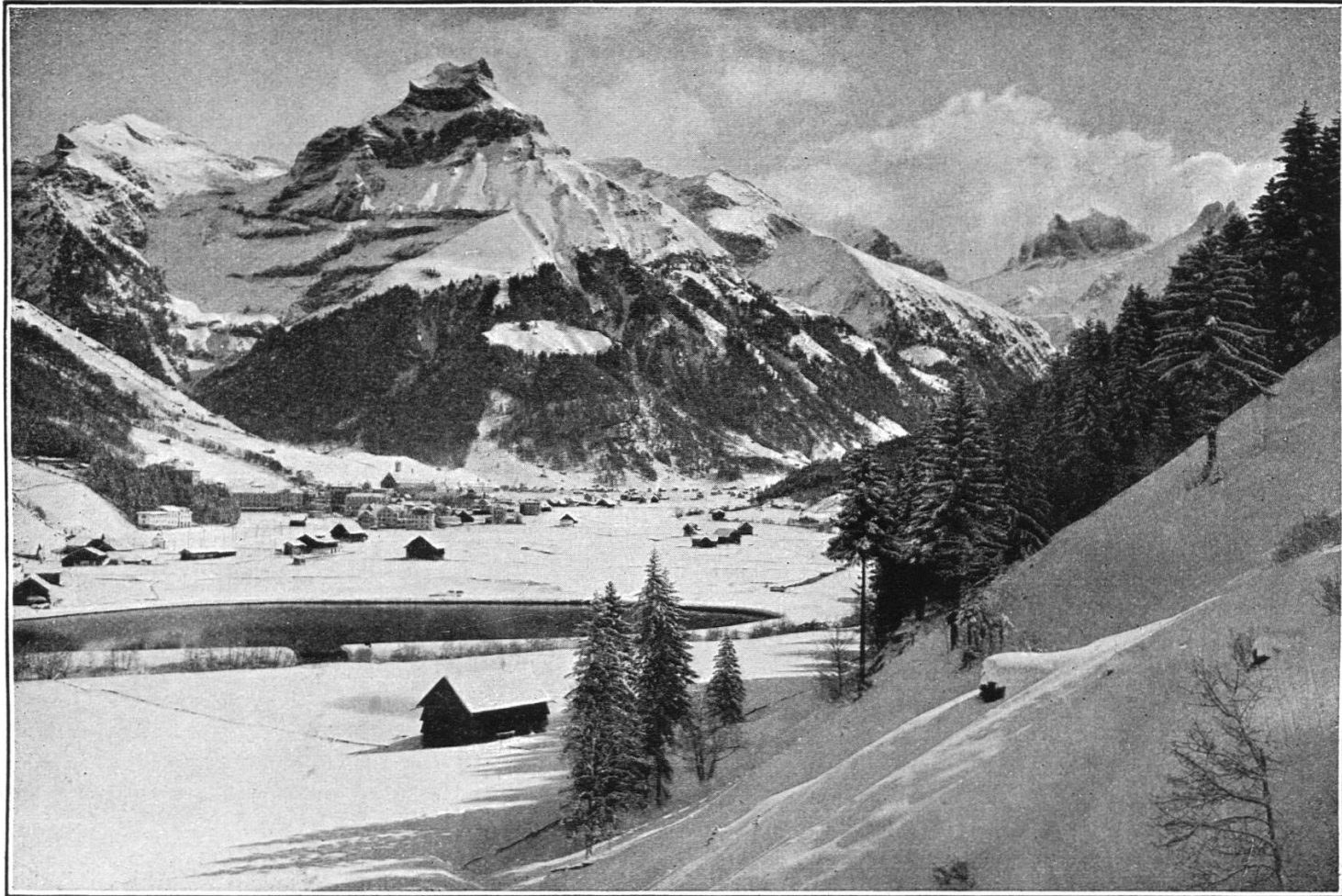
An der Sprunghalde in Engelberg.