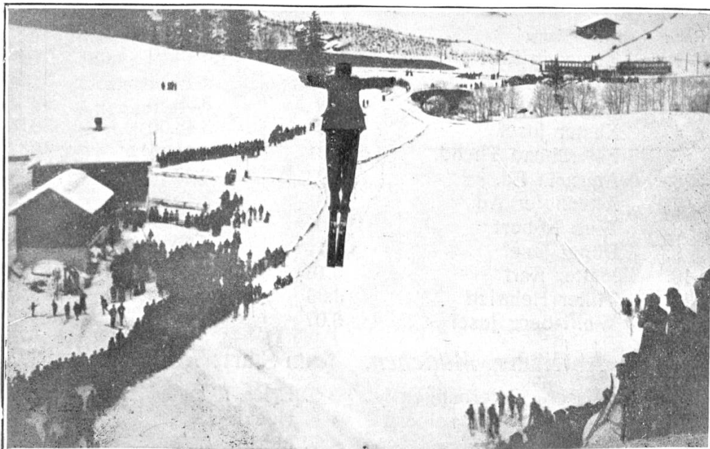
Capiti im 31.5 m Sprung