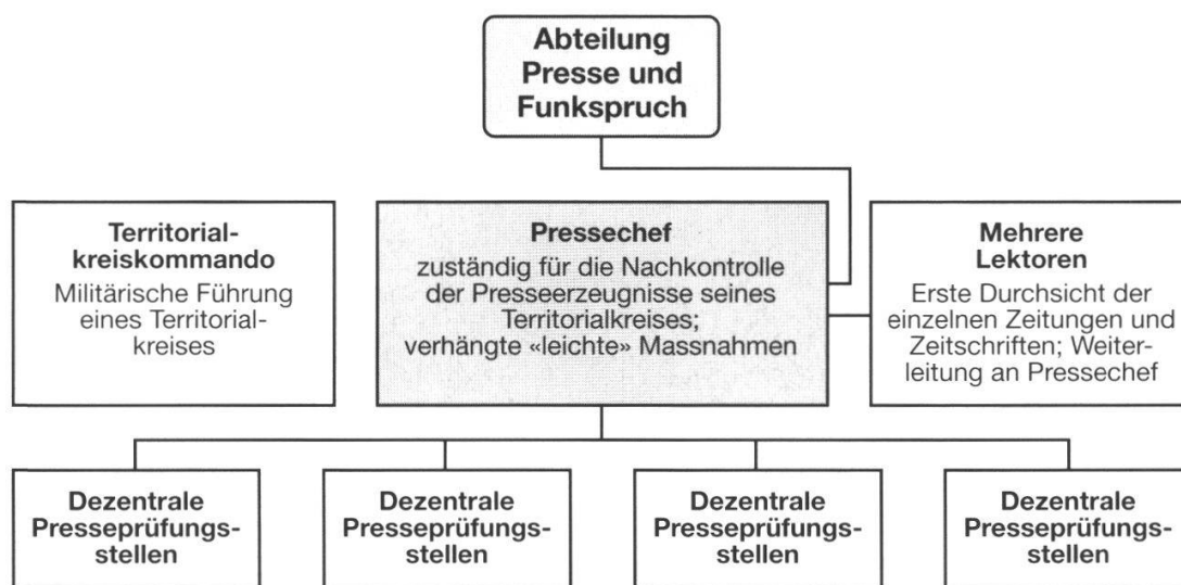
Diagramm 2: Schematischer Aufbau der dezentralen Pressekontrolle in den einzelnen Territorialkreisen. Zu beachten ist, dass in der Regel der Pressechef und die Mitglieder der dezentralen Presseprüfungsstellen (PPS) ihren Auftrag nebenamtlich absolvierten.

Mit dieser Weisung sollte wohl das Malheur des Ersten Weltkrieges verhindert werden, als Pressevertreter der damaligen Pressekontrolle vorwarfen, es fehle ihr an medienpolitischem Sachverstand – ein Vorwurf, der der Pressekontrolle vor allem im ersten Kriegsjahr auch 1939/40 nicht erspart blieb. 117 Inwiefern die Rekrutierung qualitativ geeigneter Mitarbeiter für die Pressekontrolle gelang, wird am Beispiel Olten zu untersuchen sein. Auffallend ist, dass trotz ihrer kritischen Einstellung gegenüber der Pressefreiheit im Kriegsfall die Generalstabsabteilung ausdrücklich auch «Redakteure und Verleger» als geeignete Mitarbeiter für die Pressekontrolle betrachtete.