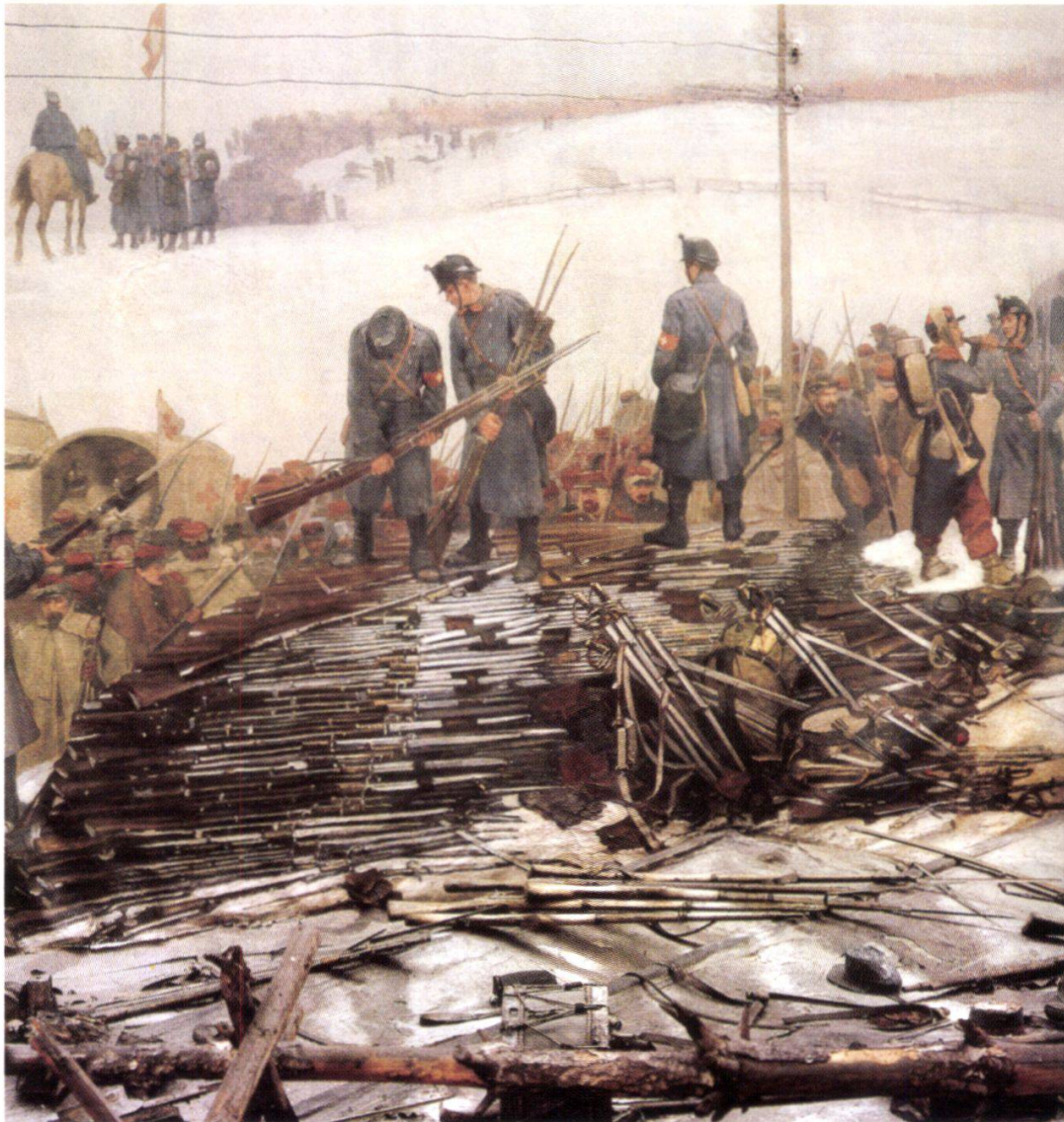
Abb. 8: Ausschnitt aus dem Bourbaki-Panorama in Luzern. Es zeigt die Entwaffnung der Infanterie.