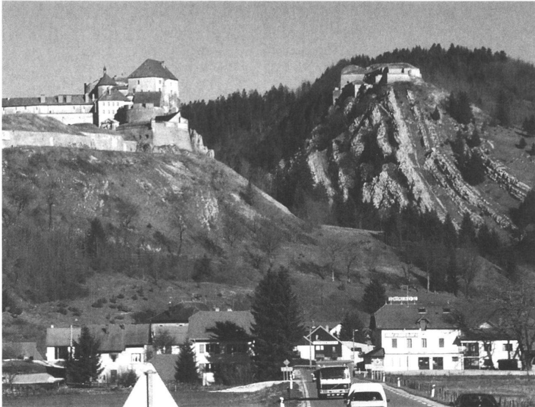
Abb. 6: Foto: La Cluse et Mijoux (Moser, 1996).

Die folgende Foto zeigt den Nordausgang der genannten Schlucht.