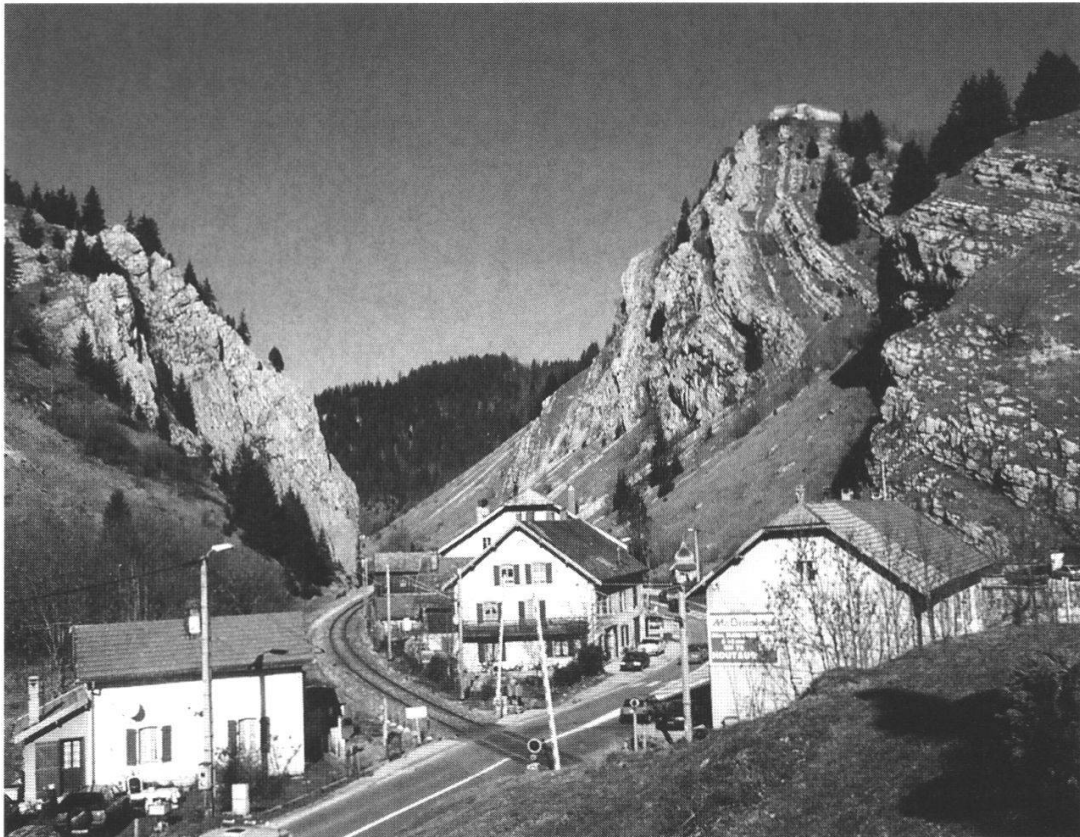
Abb. 7: Der Nordeingang der Schlucht (Moser, 1996). Höhe über Meer: 861 m.