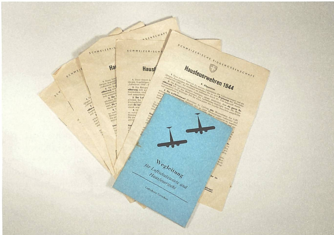
Abb. 1: Dokumente Luftschutz. Museum Grenchen, Inv. Nr.: KHM 5392.

Die Bezugsscheine und die übriggebliebenen Lebensmittelkarten der gesamten Familie Wullmann, wohnhaft an der Bielstrasse in Grenchen, befanden sich 2024 immer noch im Keller ihres Hauses. Sorgfältig aufbewahrt in dem dafür vorgesehenen Umschlag mit der Werbung der entsprechenden Geschäfte.