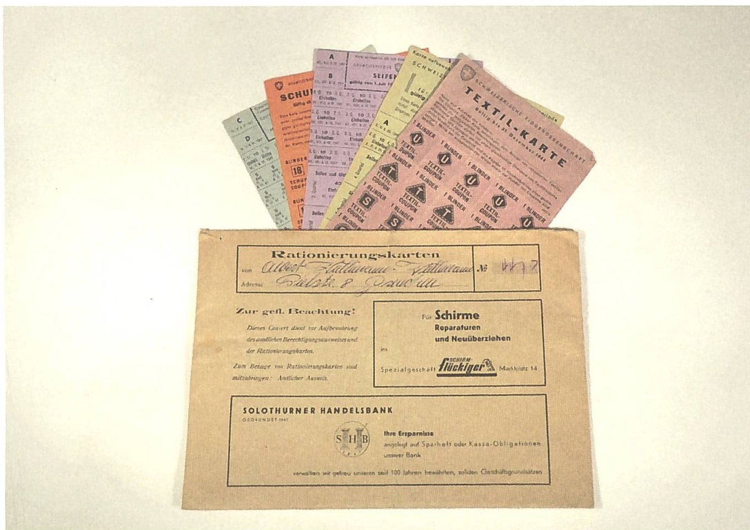
Abb. 2: Lebensmittelkarten in Couvert. Museum Grenchen, Inv. Nr.: KHMG 5542.

der Schulhäuser an der Lindenstrasse wurde 2008 eine ganze Suppenschüssel voller Suppenmarken gefunden.