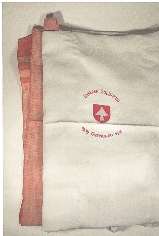
Abb. 5: Tischtuch. Museum Grenchen, Inv. Nr.: KHMG 3956.

Wappen mit der Inschrift «Unseren Soldaten – 1939 Grenchen 1945». Dieses Tischtuch schenkte die Gemeindeversammlung Grenchen im Herbst 1945 jedem Wehrmann, der während des Kriegs mindestens hundert Tage gedient hatte. Interessant in diesem Zusammenhang ist, dass die Soldaten auch die Möglichkeit hatten, sich anstatt des Tischtuchs einen Gutschein für Grenchner Geschäfte im Wert von dreissig Franken auszahlen zu lassen. Allerdings entschied sich lediglich ein Fünftel aller Grenchner Soldaten für diesen Gutschein. 6 Es ist bemerkenswert, dass sich, insbesondere in einer wirtschaftlich schwierigen Zeit, so viele für den symbolischen Wert eines Tischtuchs entschieden. Es erinnerte nicht nur an die Entbehrungen der Kriegs-