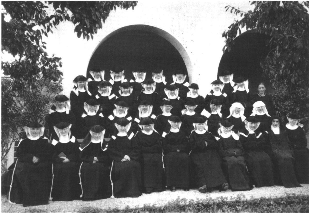
Die Klostersgemeinschaft Namen Jesu Herbst 1943 oder Frühsommer 1944. Die beiden Schwestern in weissem Schleier sind Laienschwestern, dahinter ohne Schleier eine Kandidatin, davor in anderer Tracht eine Karmelitin. Liste der abgebildeten Schwestern im Archiv.