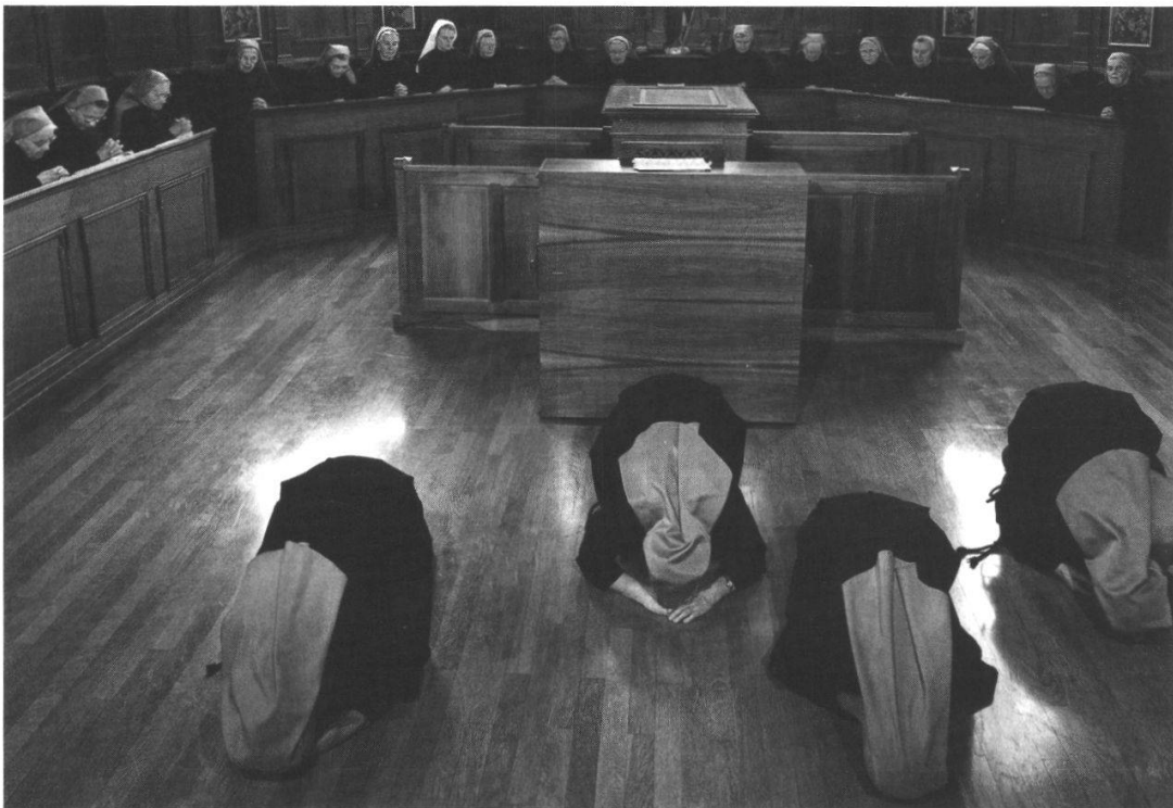
Schwestern im Chor beim Gebet ca. 1984 in der neuen Tracht. Vorne vier Schwestern die eben das Chor betreten haben bei der damals noch üblichen Prostratio, dem Sich-Niederwerfen vor Gott.