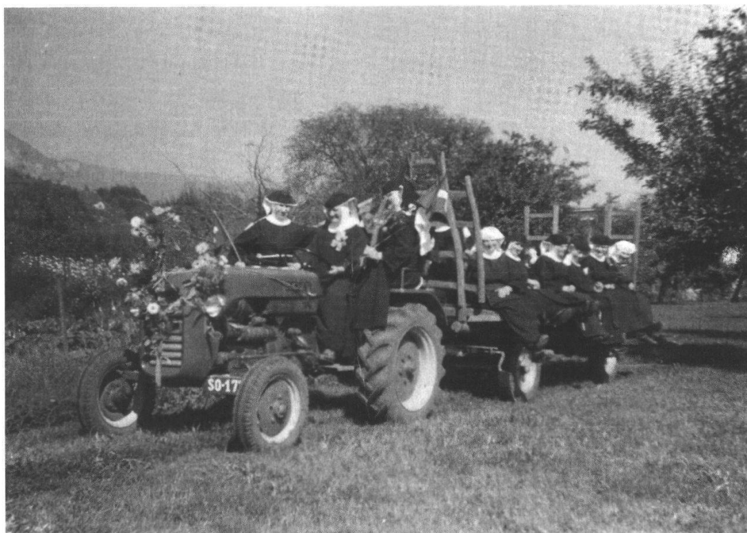
Für die durch einen Meisterknecht mit Gehilfen betriebenen Landwirtschaft des Klosters wurde ca. 1955 ein Traktor angeschafft. Schwestern auf der Jungfernfahrt innerhalb des grossen Klausurbezirkes.