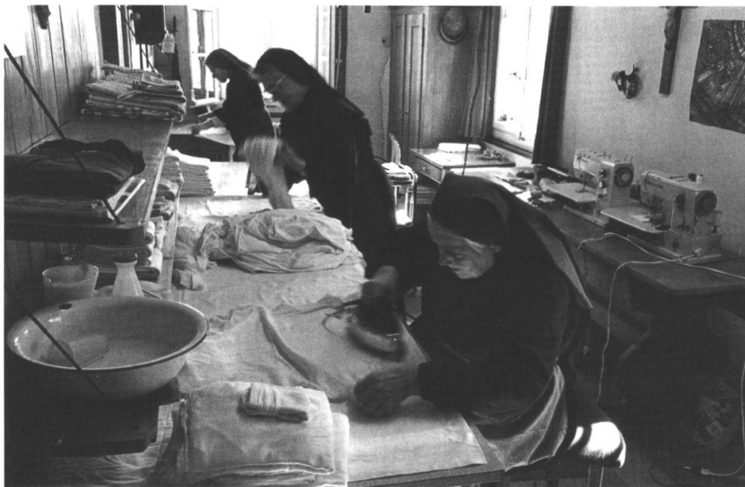
Schwestern in der Nähstube im Ökonomiegebäude beim Bügeln und Ausbessern von zur Liturgie gebrauchten Tüchern und Gewändern verschiedener Pfarreien ca. 1969. Das war damals noch ein Erwebszweig für die Klostergemeinschaft.