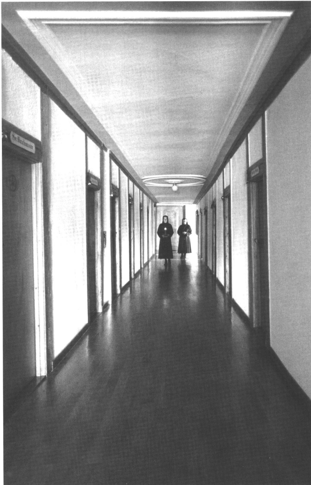
Im Dormitoriumsgang des Osttraktes. Über jeder Zellentüre steht der Name der sie bewohnenden Schwester. (Aufnahme ca. 1977 durch den Laienfotografen Bruno Hafner. Bild: Archiv Kloster Namen Jesu)