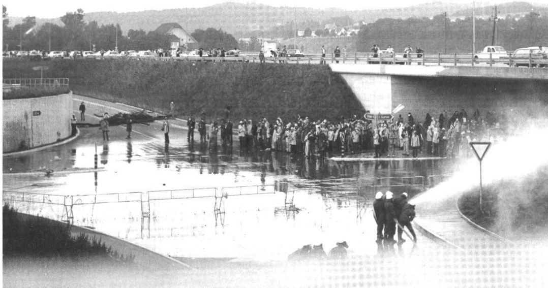
Demonstration gegen das im Bau begriffene Atomkraftwerk Gösgen beim Postzentrum Däniken am 2. Juli 1977 (Staatsarchiv Solothurn).

nischen Parteien bestellt ist, entzieht sich meiner Kenntnis, doch müsste man sich schleunigst um die Akten nicht mehr existierender politischer Gruppierungen wie des Landesrings oder der Progressiven Organisationen POCH bemühen. Durch den Priestermangel und die Überalterung klösterlicher Gemeinschaften ist auch ein Teil der geistlichen Archive gefährdet. 28 Die im 19. Jahrhundert entstandene Vereinskultur ist in Auflösung begriffen, doch jedes Vereinsarchiv kann nicht dem Staatsarchiv überantwortet werden, vor allem nicht in völlig ungeordnetem und lückenhaftem Zustand. 29 Glücklicherweise mangelt es an Vereins- und Verbandsfestschriften nicht.