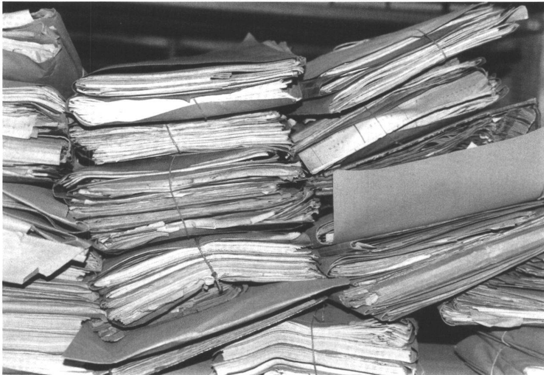
Unstrukturierte Alt-Ablage einer kantonalen Amtsstelle 1998.

Verwaltungsabteilungen, die durch die Aktenflut verursachte generelle Archivraumknappheit der meisten Dienststellen und die Dynamik der Reorganisationen und Umstrukturierungen innerhalb der kantonalen Administration waren einer kontinuierlichen Überlieferung nicht eben förderlich. Die bei den Departementen, Ämtern und Abteilungen festgestellten Datenverluste sind teilweise gravierend.