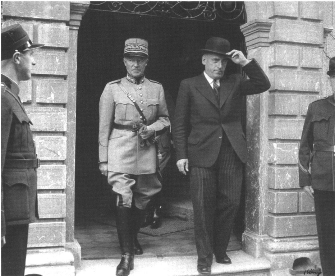
General Henri Guisan anlässlich seines Abschiedsbesuchs in Solothurn am 19. September 1945 in Begleitung von Landammann Otto Stampfli beim Verlassen des Rathauses: «Mir danken Euch, s'isch schön, ass 's hüt im hinderst Tal Vo Tür zu Türe goht und 's heisst, s'isch üse General!» (Staatsarchiv Solothurn, Foto: Hans König, Solothurn).

Schutzfristen von 30 Jahren seit dem Tod oder 110 Jahren seit der Geburt. Die Individualisierung der Sperr- oder Schutzfristen hat zur Folge, dass Dossiers mit sensiblen Personendaten nicht mehr seriell durchgesehen werden dürfen. Immerhin liess sich im Zusammenhang mit dem Archivgesetz das Informations- und Datenschutzgesetz dahingehend ändern, dass amtliche Dokumente aus nicht öffentlichen Verhandlungen, zum Beispiel Kommissionsprotokolle, nach 30 Jahren zugänglich sind und dass für die Forschung ein Zugang vor Ablauf der Schutzfristen bewilligt werden kann. Hier müssen, gerade was die Akten aus dem Sozialbereich betrifft, in Zusammenarbeit mit dem kantonalen Datenschutzbeauftragten noch Benutzungsmodalitäten formuliert werden. Auf dessen Website ist übrigens bereits eine Muster-Datenschutzvereinbarung greifbar. 12