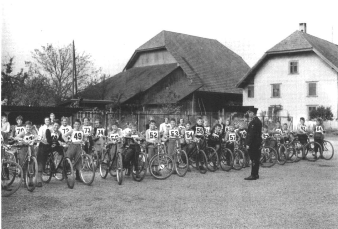
Abnahme der 1954 eingeführten Schülerradfahrer-Prüfung in Biberist am 29. Oktober 1955.

Verfügung. 19 Auf dem Gebiet der historischen Forschung wirkt sich die Tatsache, dass Solothurn eine gewachsene und keine gegründete Stadt ist, negativ aus. Im Unterschied zu Freiburg im Üchtland, das sich im Jubiläumsjahr 2007 eine Stadtgeschichte des 19./20. Jahrhunderts geschenkt hat, 20 droht in der Ambassadorsstadt nie ein rundes Datum, das gefeiert werden will und die Historiker/innen-Zunft zu Höchstleistungen anspornt. Monographien über so bedeutende Themen wie die städtische Verwaltungsgeschichte seit 1803 oder die Entwicklung der städtischen Infrastruktur wären ein dringendes Desiderat. 21