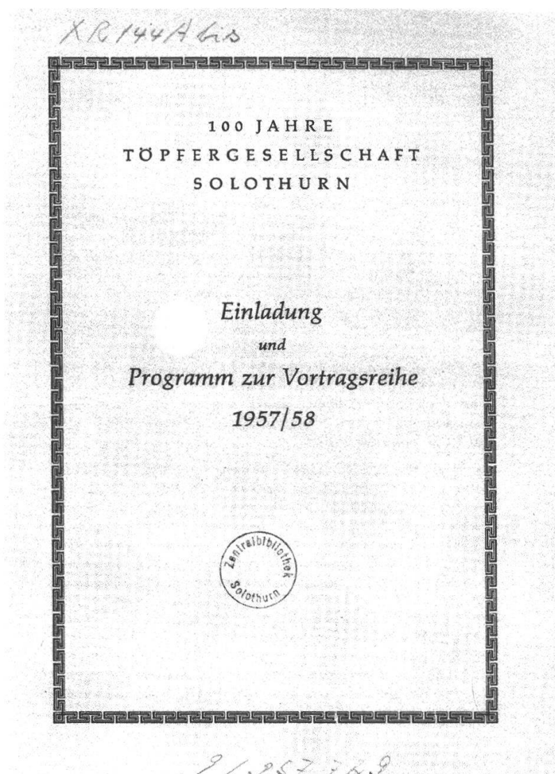
Abb. 2 Einladung zur Jubiläumssaison 1957/58