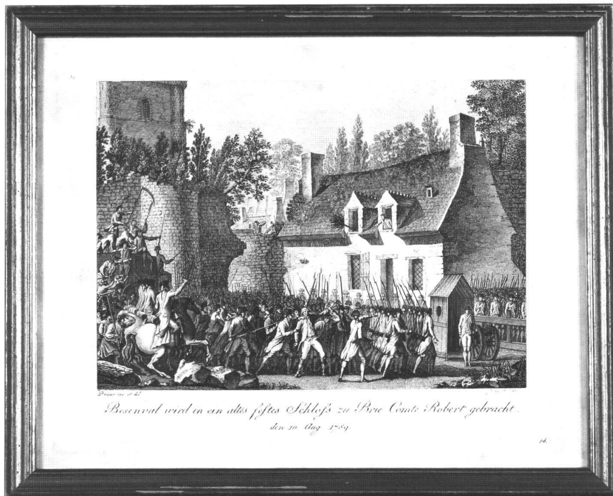
Abb. 4: Die Verhaftung des Barons am 10. August 1789. Stich von Prieur und J.An. Otto. 14. Blatt aus dem «Denkbuch der franzoesischen Revolution vom ersten Auf- ruhr in der Vorstadt S.Antoine den 28.April 1789 bis zum Todestag Ludwigs XVI. den 21.Jänner 1793 in 42 Kupfern». Band 1, Memmingen 1815. Museum Schloss Waldegg.

erprobten, altgedienten General bass erstaunen kann, breitete er auf dem Wirtshaustisch seine Landkarte aus und fragte Gäste und Wirt, wo hier eine Strasse Richtung Schweiz durch führe, die keine grössere Stadt durchquere. 39 Der Wirt roch den Pfeffer, nahm an, sein Gast sei ein flüchtiger Aristokrat, und suchte im Dorf einige bewaffnete Männer zusammen. Sie nahmen ihn fest und liessen ihn nach Paris bringen, wo er in Untersuchungshaft gesetzt wurde.