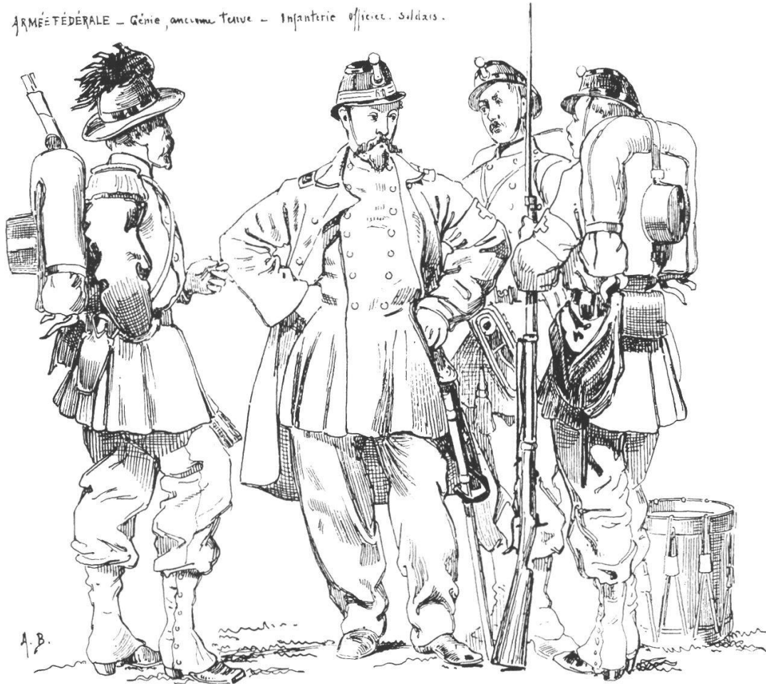
Abb. 2: Aus: A. Bachelin, «Aux frontières», 1870/1871, Eidgenössische Armee. Links: Genietruppe, alte Uniform; rechts: Infanterie, Offizier und Soldaten.

ARMÉE FÉDÉRALE – Génie, ancienne tenue – Infanterie officiers, soldats.