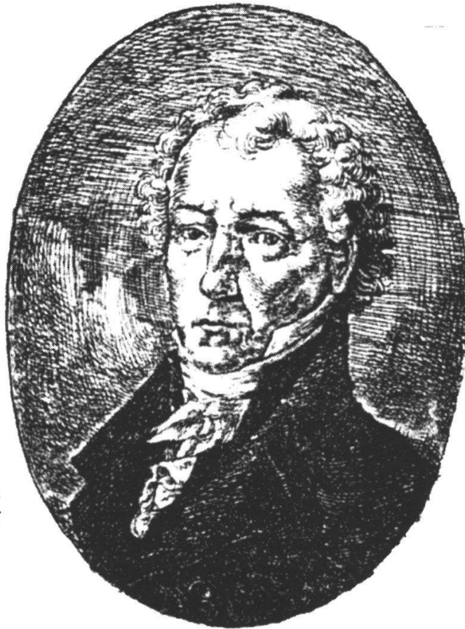
Abb. 6: Xaver Zeltner in späteren Jahren, nach einem Stich in der National-Bibliothek Warschau. Aus: Bartłomiej Szyndler: Tadeusz Kosciuszko 1746–1817. Ausgabe 1991, S. 355.

abgebildet 262 (Abb. 6), laut Pass 263 war er blond und hellhäutig, hatte graue Augen und mass etwa 159 cm. 264