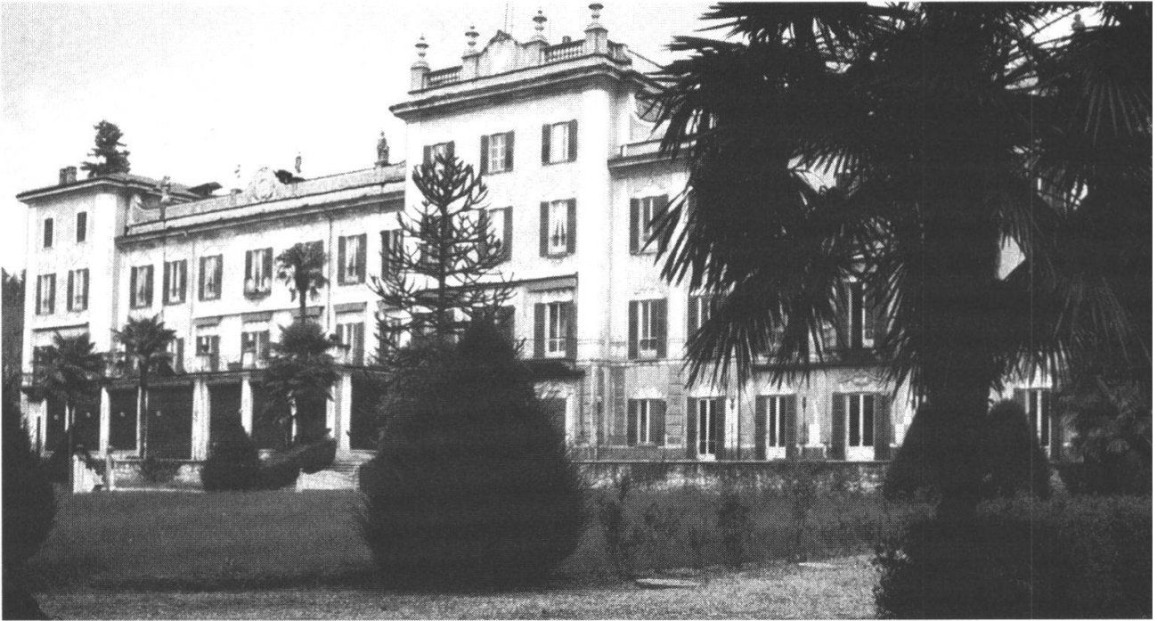
Abb. 5: Ehemalige Villa Morosini in Casbeno/Varese (heute Ortsverwaltung).