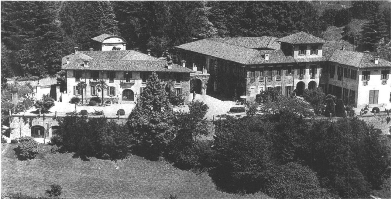
Abb. 4: Ehemalige Villa Morosini in Vezia (heute Kurszentrum der Stadt Lugano).

geschmähten Vater Zeltner muss die prunkvolle Hochzeit in der St. Ursenkirche am 17. Mai 1819 231 ein Lichtblick gewesen sein.