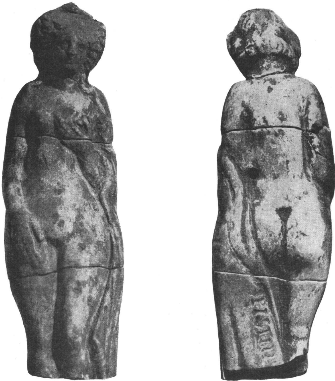
Die «Venus von Olten»