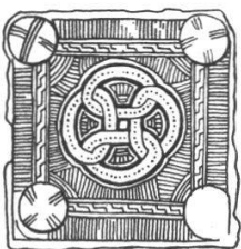
ZULLWIL BEZ: THIERSTEIN, SOLOTHURN