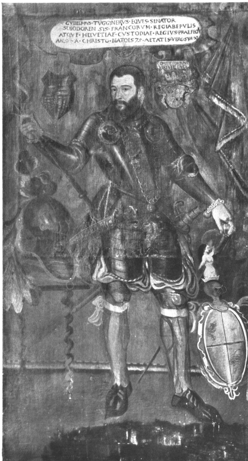
Oberst Wilhelm Tugginer, Ritter 1526—1591