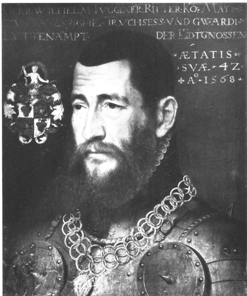
Oberst Wilhelm Tugginer, Ritter 1526—1591