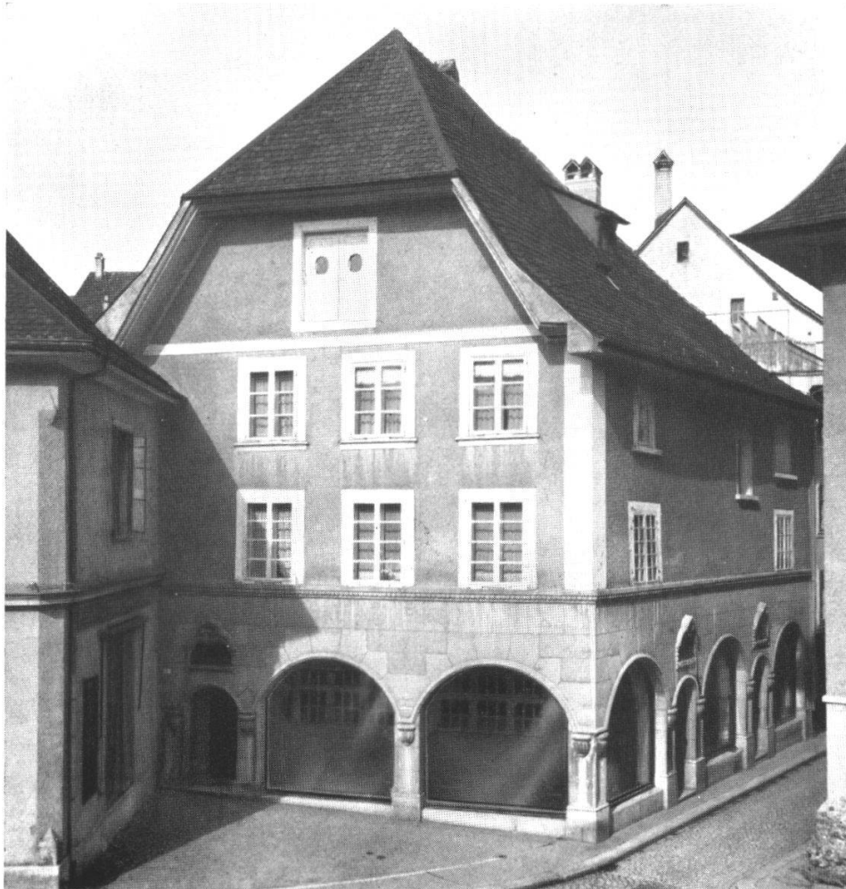
Tugginerhaus auf dem Friedhofplatz gekauft 1562