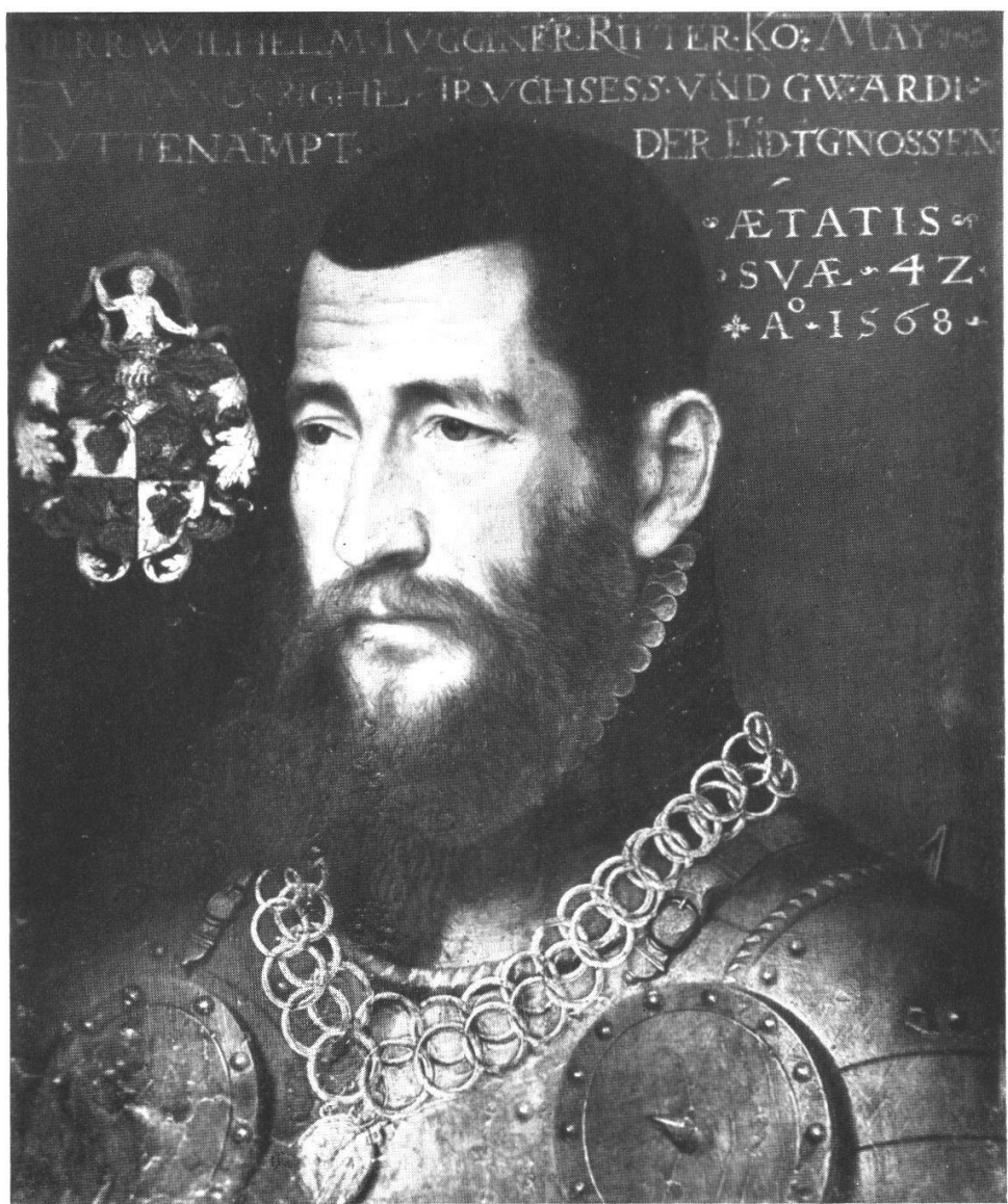
Oberst Wilhelm Tugginer, Ritter 1526—1591