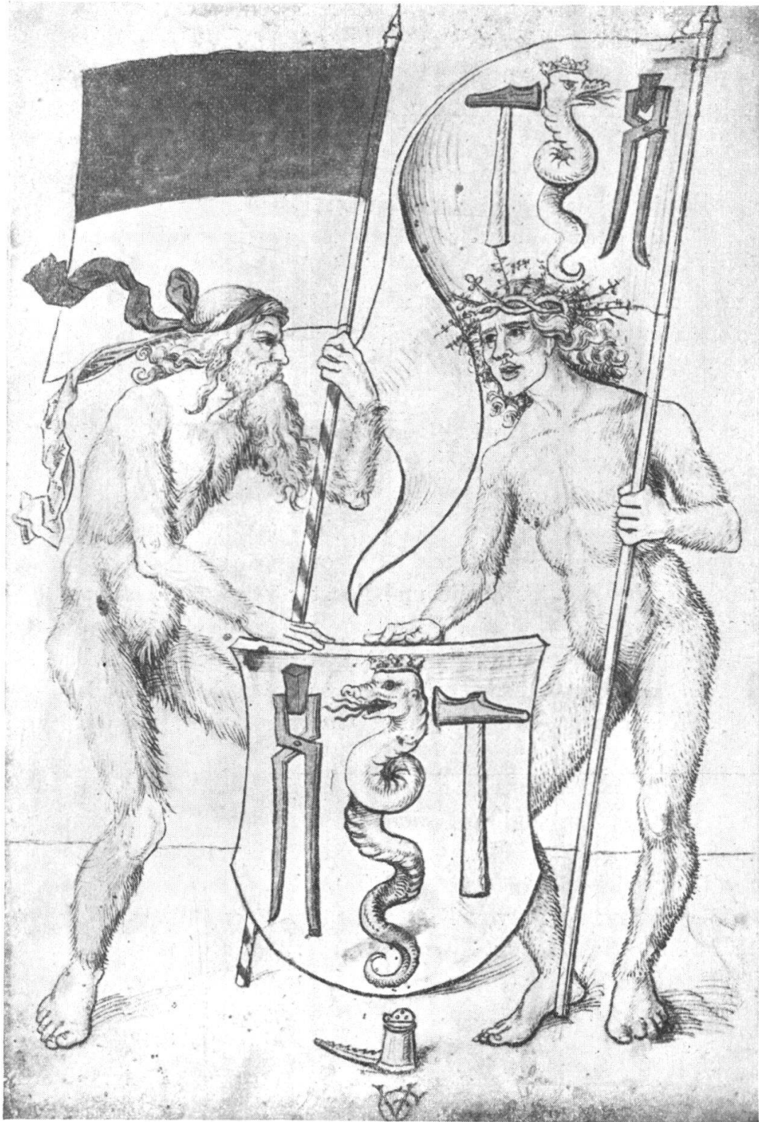
Wappen der Zunft zu Schmieden in Solothurn. Federzeichnung von Urs Graf. Titelblatt aus dem 1. Protokoll der Schmiedezunft; jetzt im städt. Museum Solothurn.