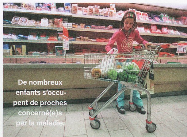
De nombreux enfants s'occupent de proches concerné(e)s par la maladie.